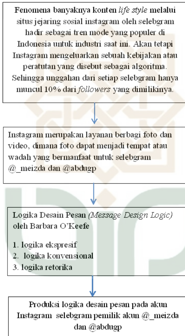
Bagan 1. Kerangka Berpikir