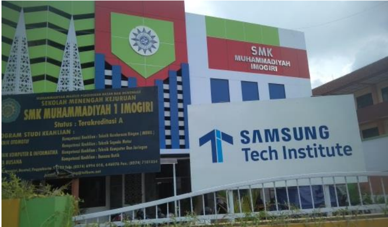
Gedung SMK Muhim Imogiri