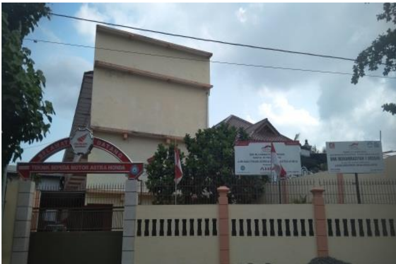
Gedung praktek astra honda motor