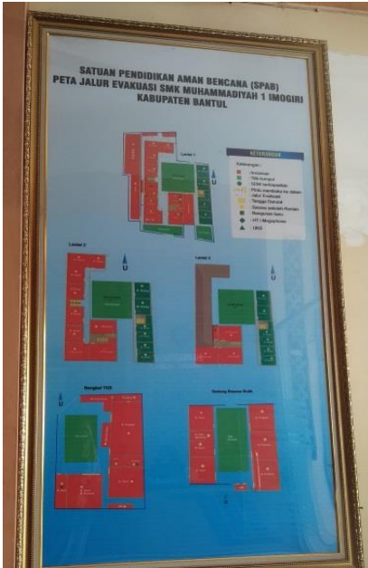
Denah SMK Muhim Imogiri