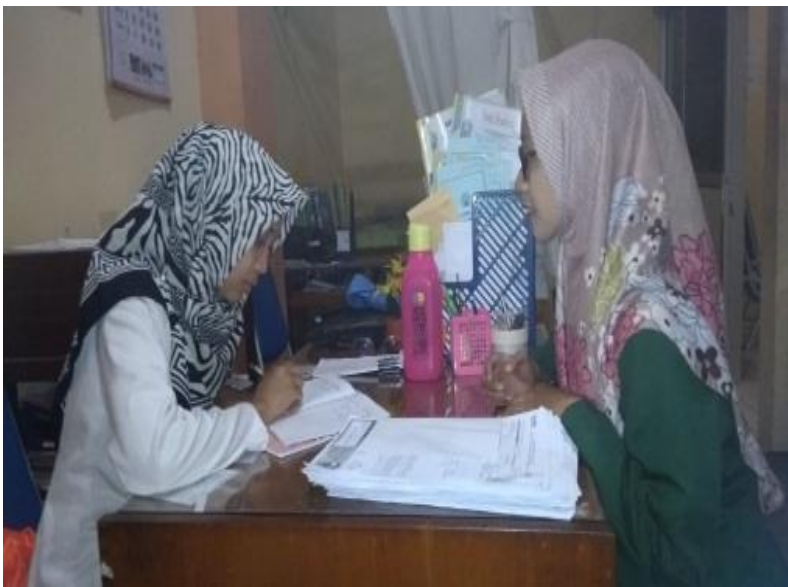
Wawancara dengan guru BK