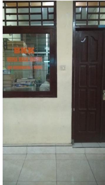
Ruang BK dan BKK