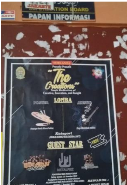
Papan Informasi karir