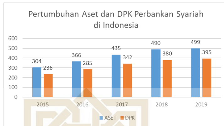
Gambar 1. 1 Diagram Pertumbuhan Aset dan DPK Bank Syariah