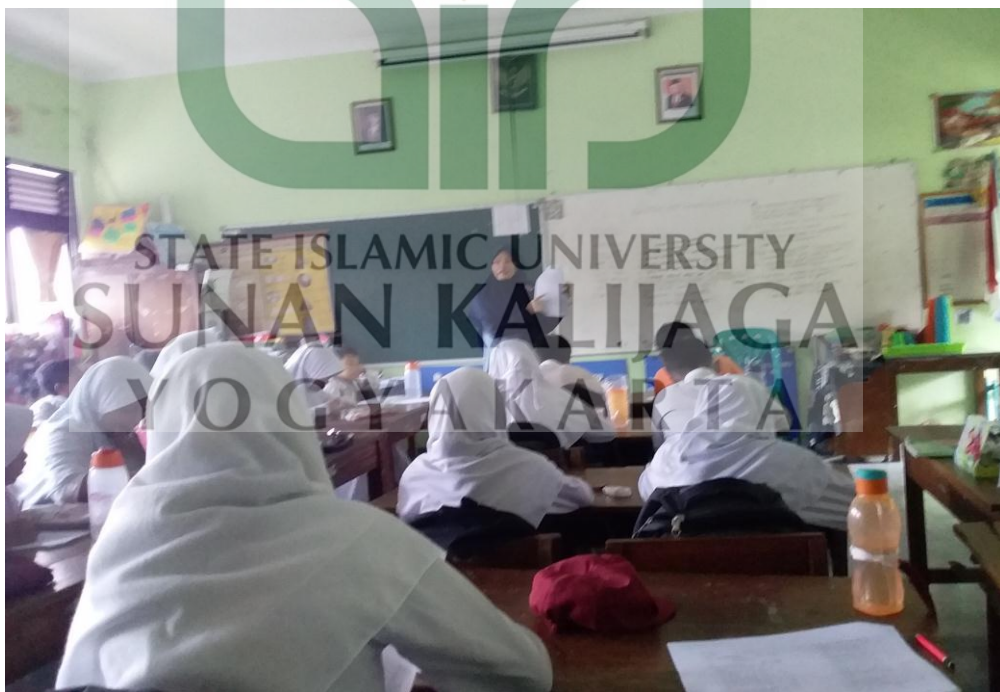
Peneliti menjelaskan cara pengisian angket kepada responden