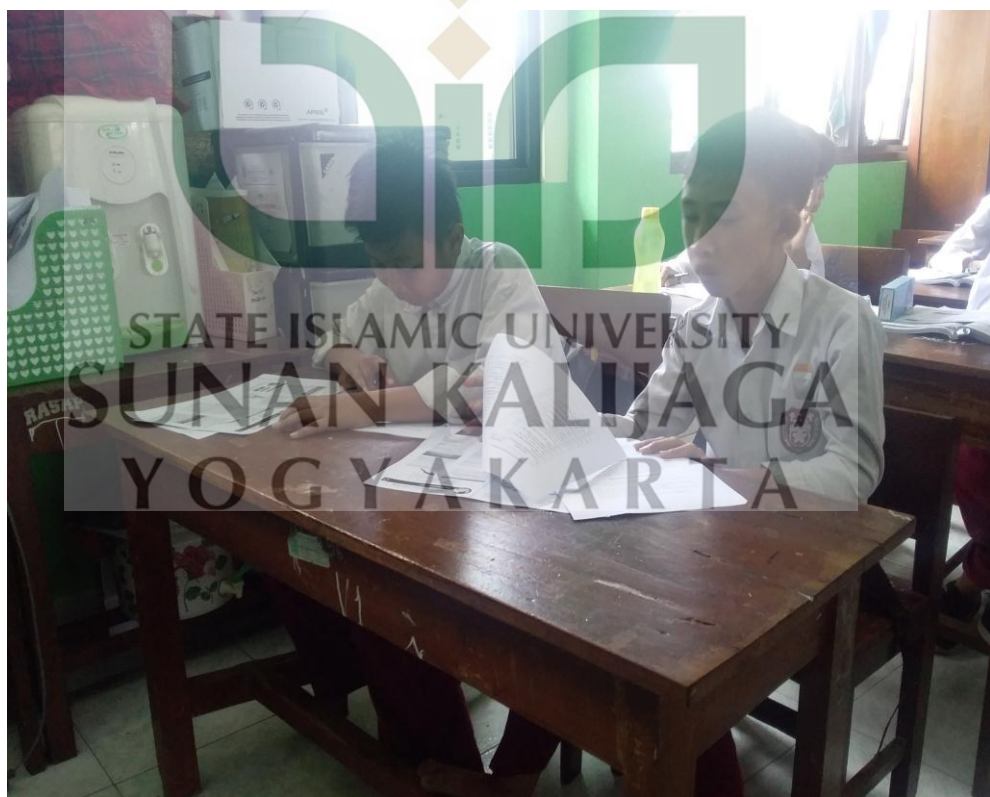
Responden mengisi angket yang telah dibagikan oleh peneliti