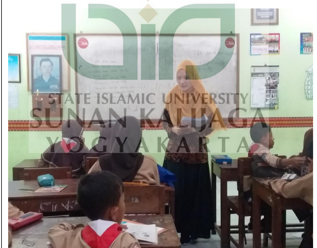
Peneliti mengumpulkan kembali angket yang telah diisi oleh responden