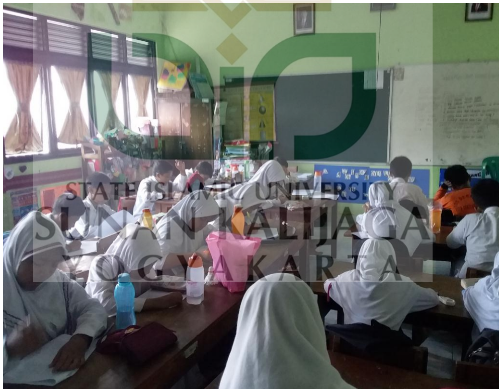
Responden mengisi angket yang telah dibagikan oleh peneliti