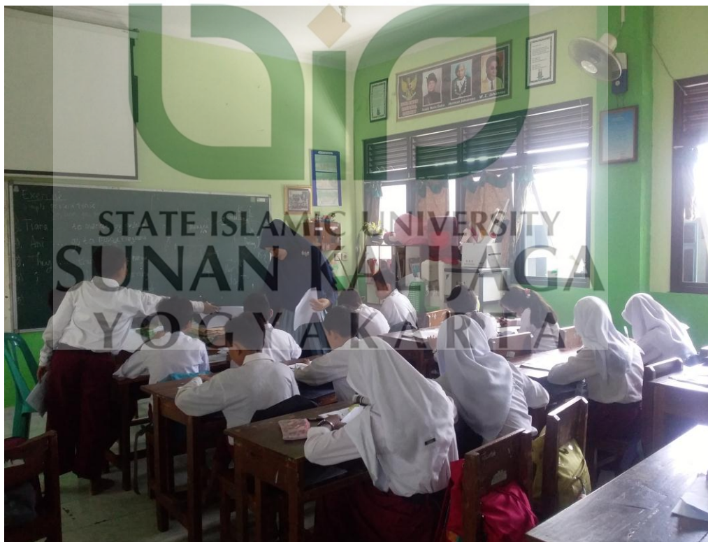
Peneliti mengawasi responden selama pengisian angket