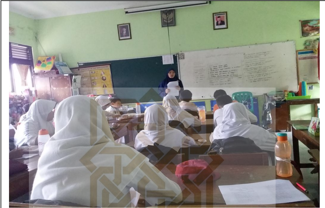
Peneliti memperkenalkan diri serta menjelaskan maksud dan tujuan kedatangan peneliti kepada responden