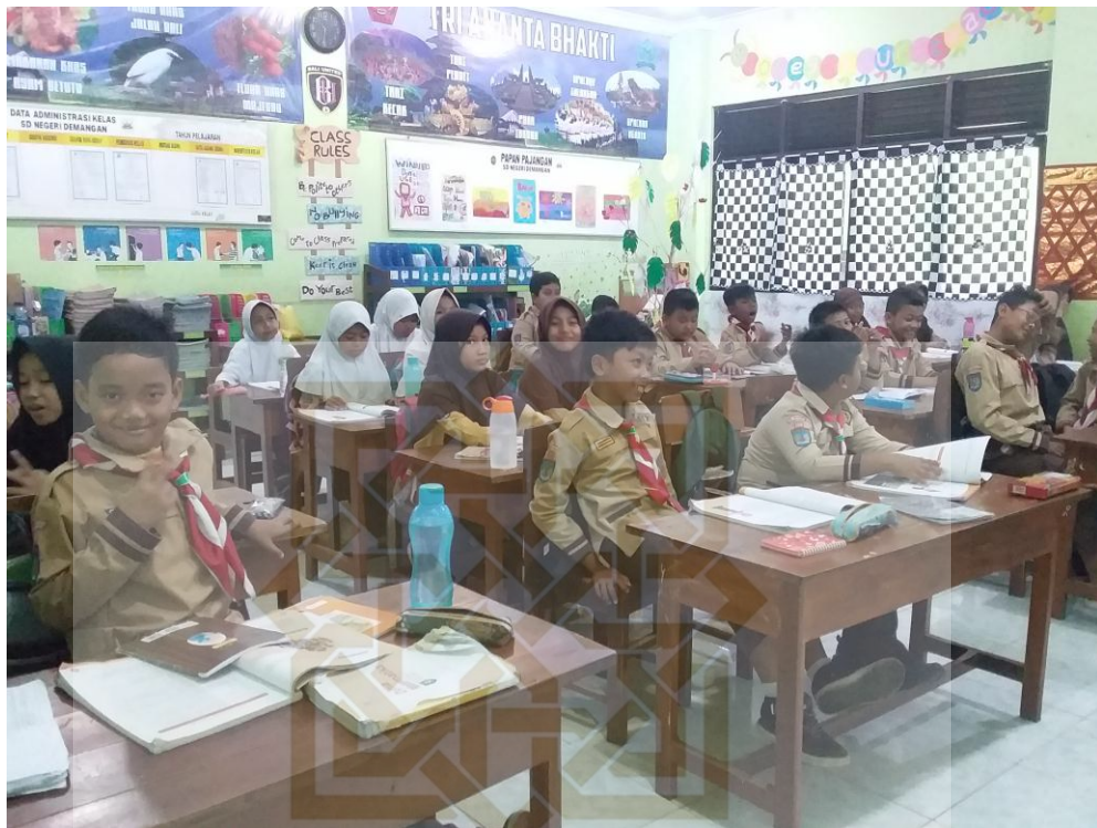
Responden menyimak cara pengisian angket dari penjelasan responden