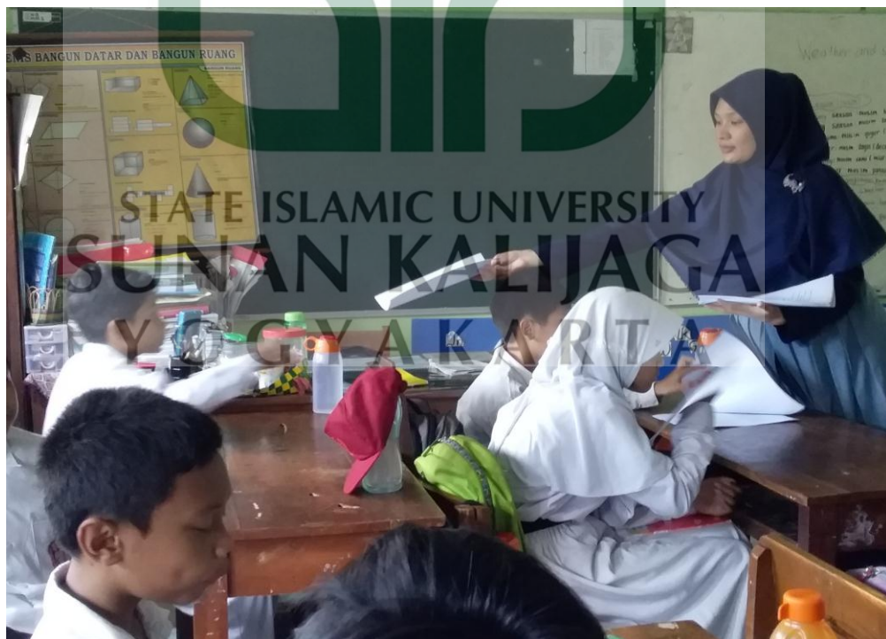
Peneliti membagikan angket kepada responden