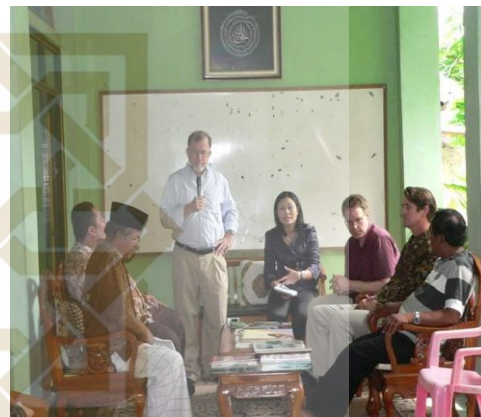
Kunjungan Senator AS yang tergabung dalam komnas kebebasan agama AS