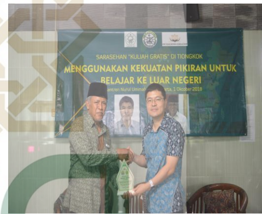
Sarasehan dan kuliah gratis di Tiogkok