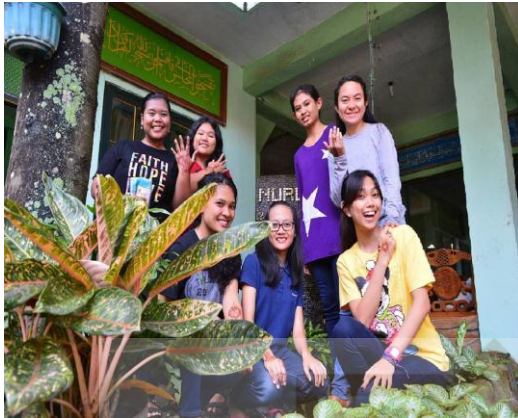
Live in mahasiswi UKDW di Pondok Pesantren Nurul Ummahat