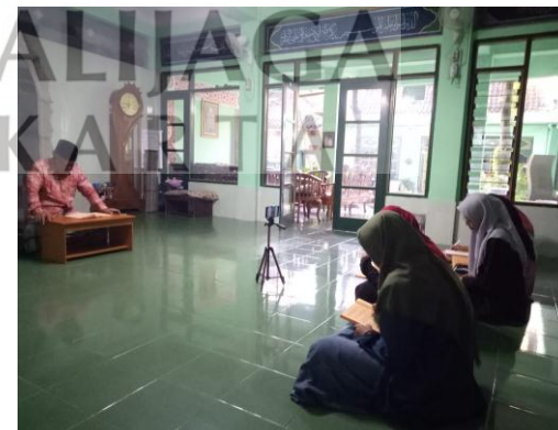
Pembelajaran di pondok pesantren Nurul Ummahat