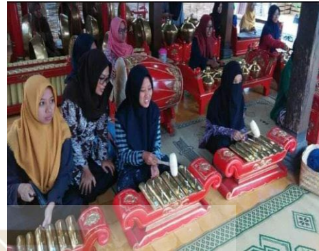
Santri bercadar dari pondok pesantren Nurul Ummahat sedang memainkan gamelan