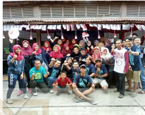
Perayaan semarak HUT RI dengan warga sekitar