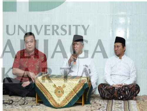
Acara Gusdurian mengundang saudara dari Kong Hu Cu