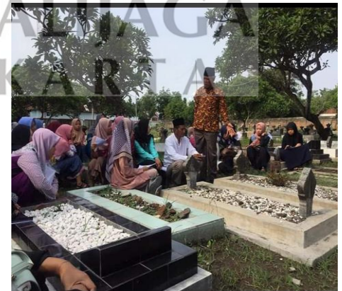
Ziarah pejuang kemerdekaan RI