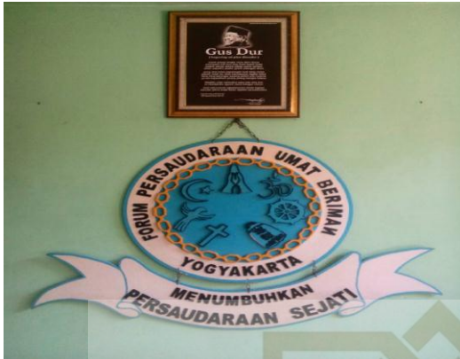
Plakat FPUB di sudut pondok pesantren Nurul Ummahat Kotagede Yogyakarta