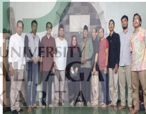
Tamu dari Palestina beserta tokoh-tokoh agama