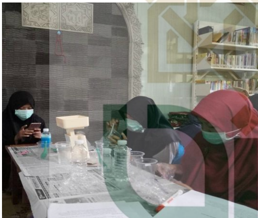
Pelatihan Keterampilan untuk santri di pondok pesantren Nurul Ummahat