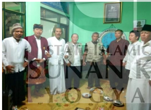
Forum Persaudaraan Umat Beriman saat mengadakan acara yang bertempat di Pondok Pesantren Nurul Ummahat