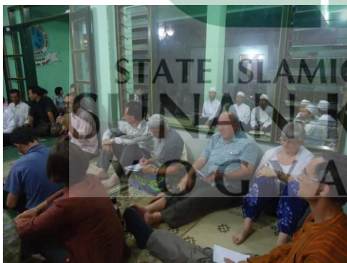
Kunjungan rombongan dari Prancis