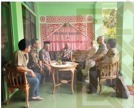
Kunjungan tamu dari Mission 21 Switzerland untuk Memahami Peran Pesantren dalam Membangun Kehidupan Multikultur