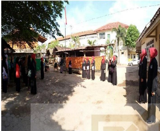
Upacara Bendera peringatan HUT RI