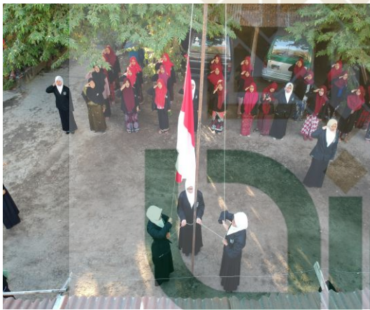
Upacara bendera dalam rangka memperingati Hari Santri Nasional