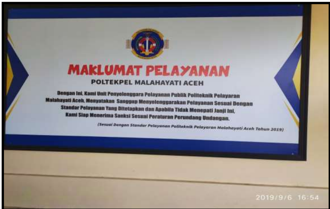
(Komitmen pelayanan yang diberikan Politeknik Malahayati Aceh)