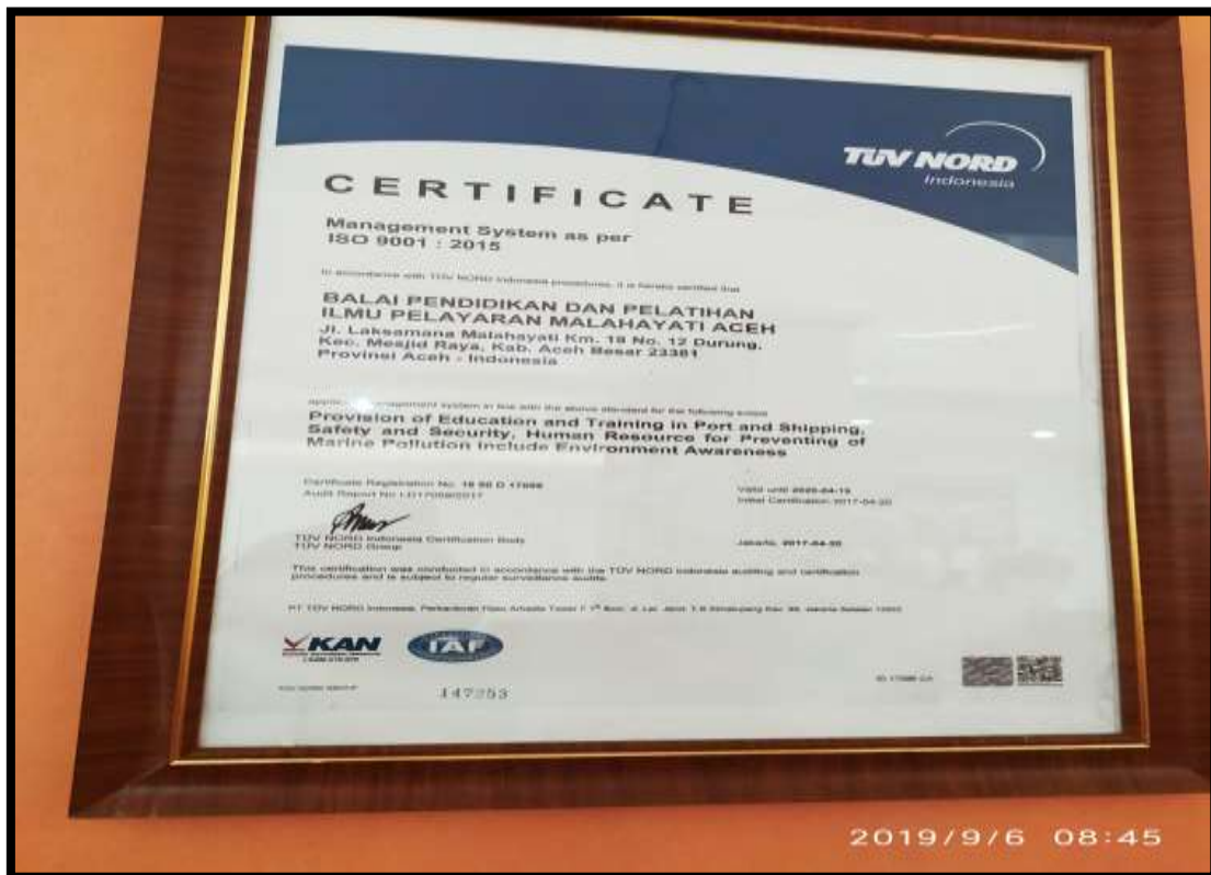
(Politeknik Pelayaran Malahayati Aceh tersertifikasi ISO 9001: 2005)