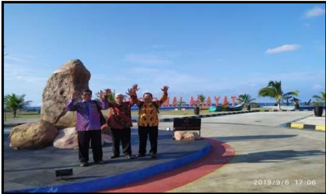
(Kehadiran penulis di lokasi penelitian-Politeknik Pelayaran Malahayati Aceh)