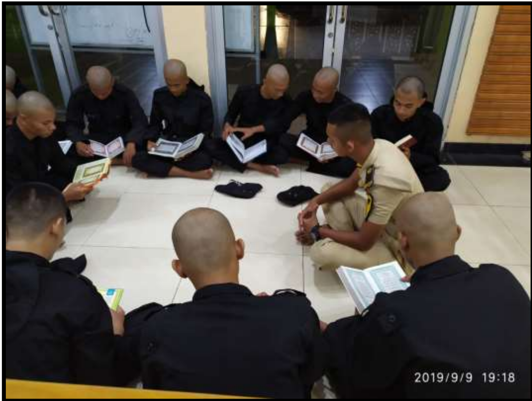
(Pelaksanaan bimbingan kerohanian Islam yang dilaksanakan secara mandiri, dibawah pemantauan taruna seior)