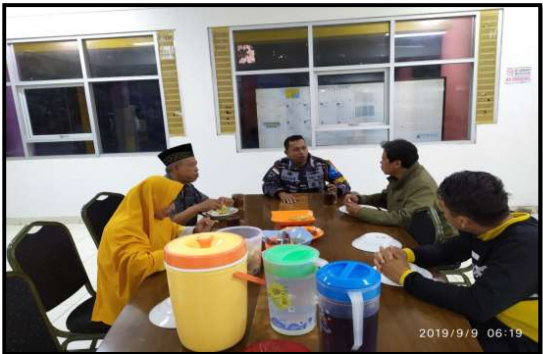
(Penulis melakukan observasi langsung kegiatan santap bersama taruna, dan melakukan wawancara bersama pelatih dan pengasuh taruna/taruni di Politeknik Pelayaran Malahayati Aceh)