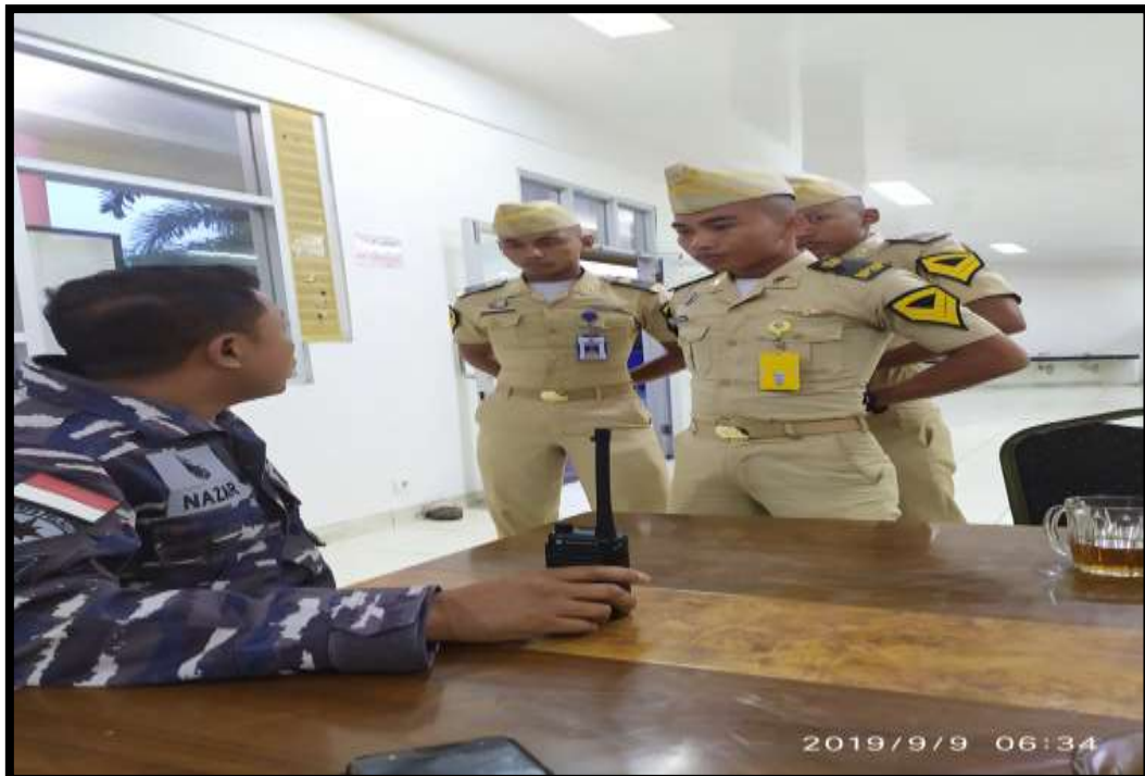
(taruna yang bertugas sebagai piket makan malam, memberikan laporan dan sekaligus menerima arahan dari pelatih)