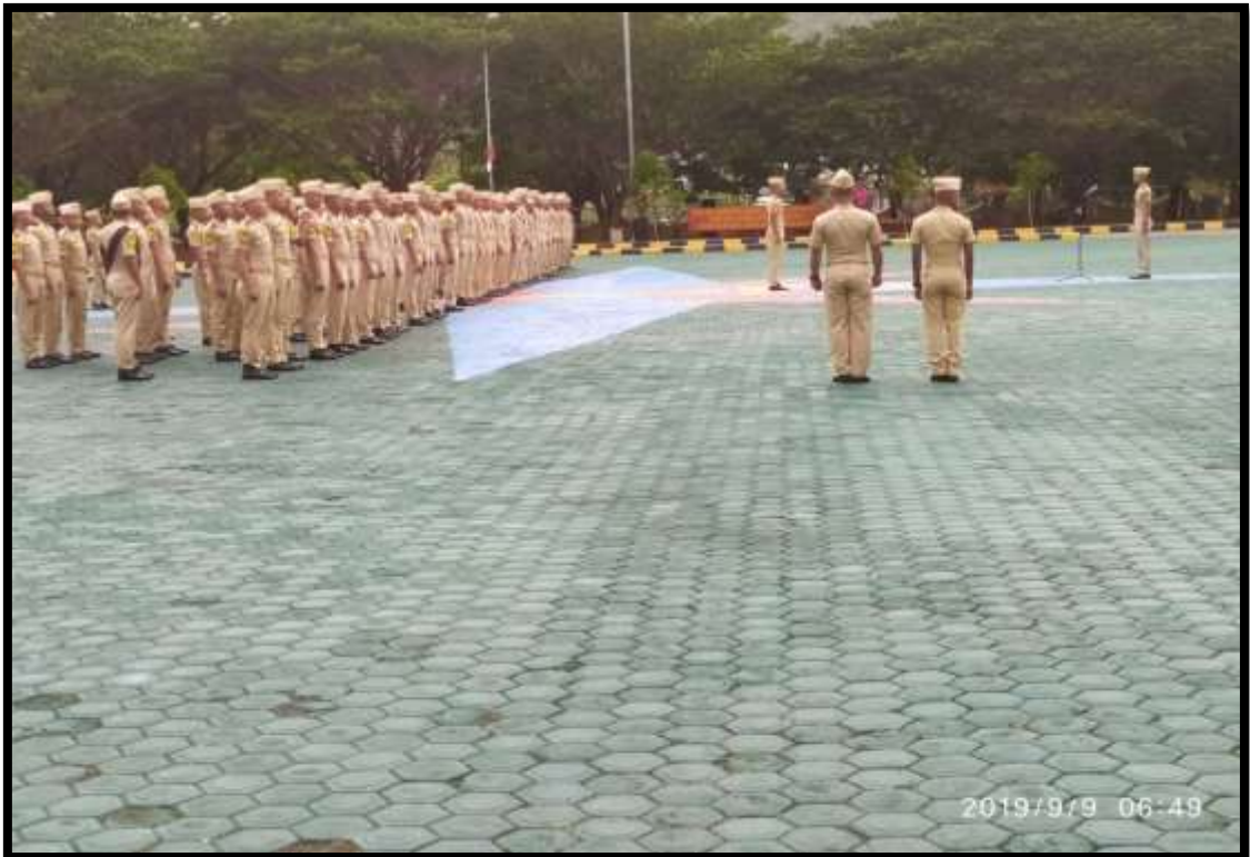
(Pelaksanaan apel pagi sebagai bentuk kesiapan taruna/taruni dalam melaksanakan aktivitas harian)