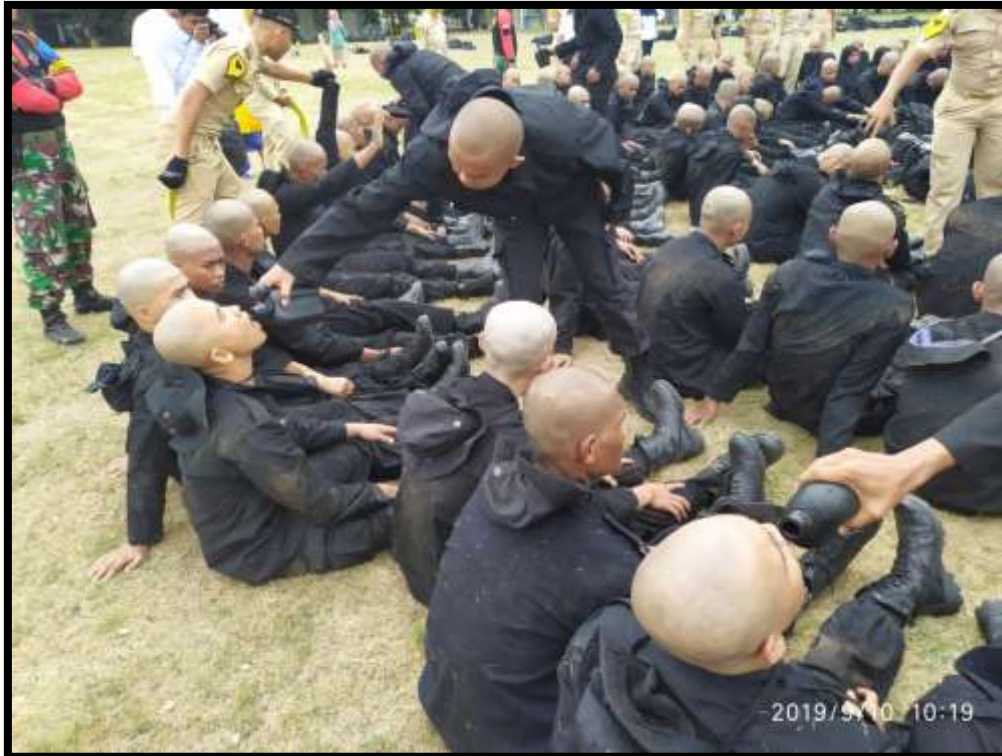
(Taruna muda dilatih untuk memiliki perasaan empati, semangat kebersamaan, tolong-menolong, hal ini diharapkan dapat menumbuhkan jiwa solidaritas yang tinggi, dan peka terhadap kondisi sosial yang ada disekitarnya)