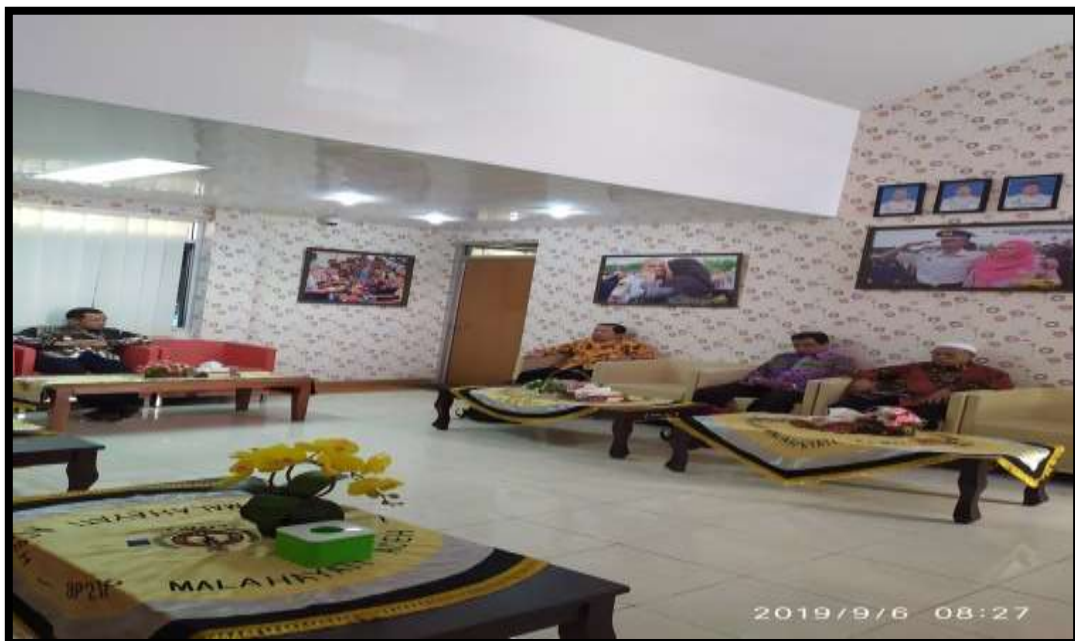
(Penyambutan dari unsur pimpinan/pengelola Politeknik Pelayaran Malahayati Aceh )