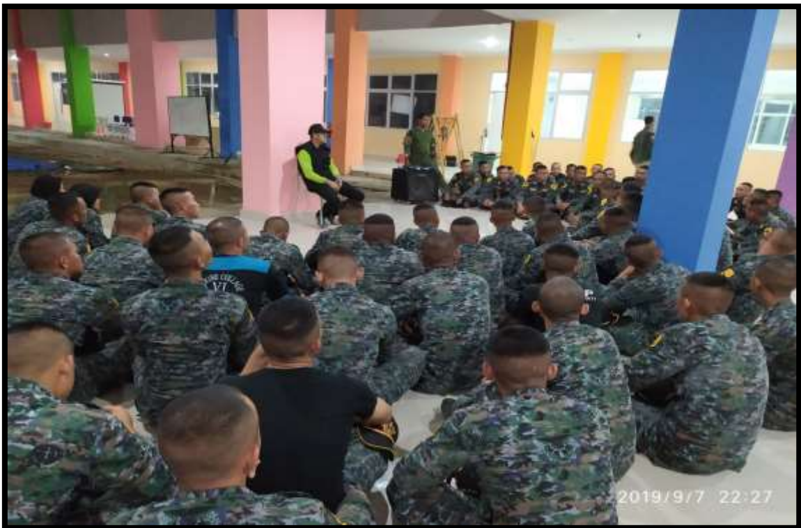
(Pelatih melakukan evaluasi harian bersama seluruh taruna/taruni, dan sekaligus memberikan arahan terkait dengan kegiatan harian esok hari)