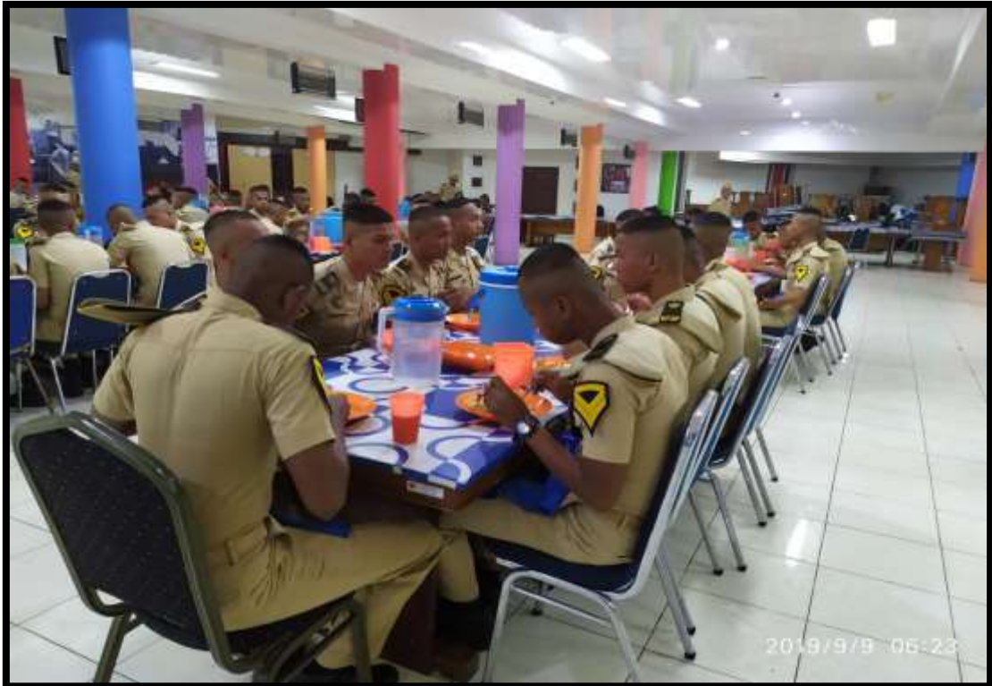
(Suasana tertib dan khidmat saat taruna/taruni melaksanakan kegiatan santap bersama)