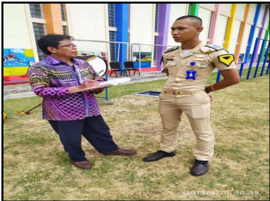
(Penulis melakukan wawancara bersama taruna Politeknik Pelayaran Malahayati Aceh)