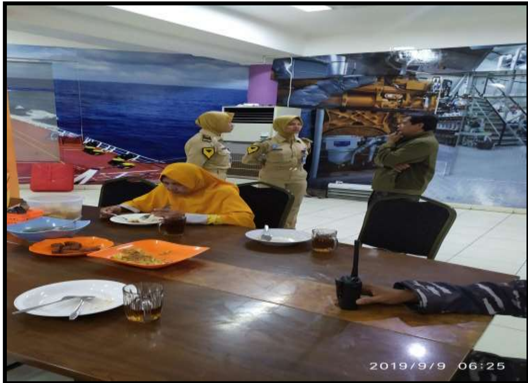
(Penulis menyempatkan diri untuk mewawancarai secara langsung taruni yang bertugas sebagai petugas piket makan malam)