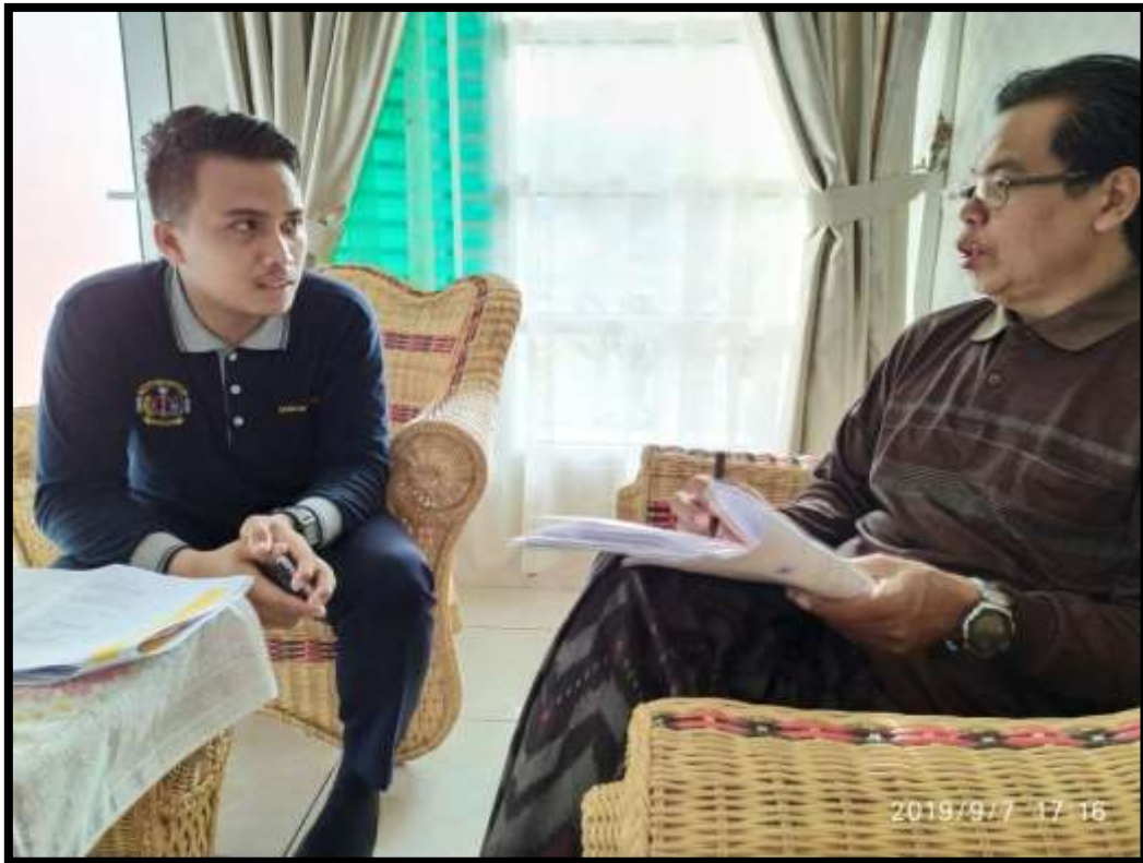
(Penulis melakukan wawancara bersama pengasuh Politeknik Pelayaran Malahayati Aceh)