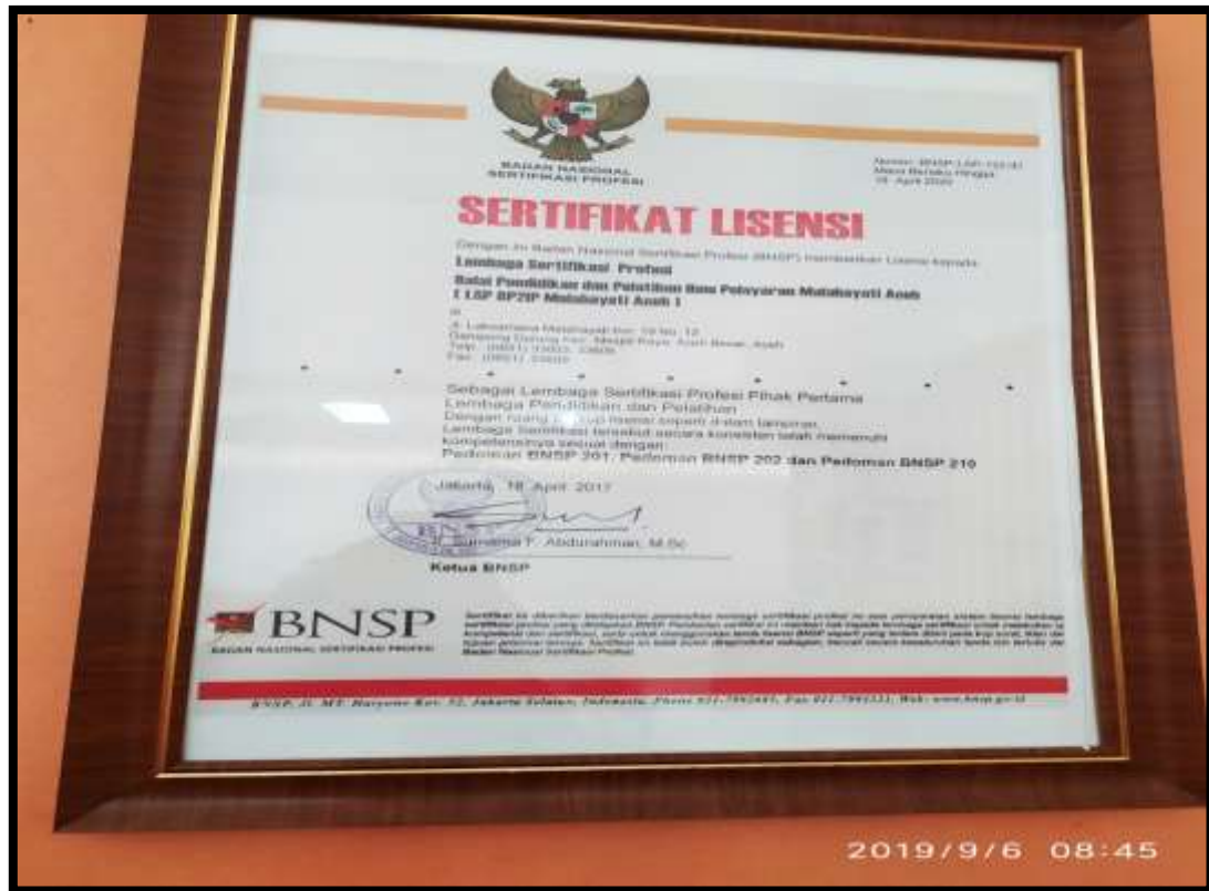
(Sertifikasi Politeknik Pelayaran Malahayati Aceh Sebagai Lembaga Pendidikan Profesi)