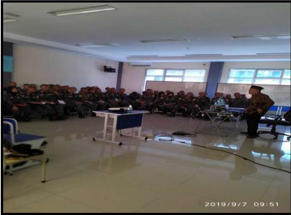
((Taruna dikenalkan dengan nilai-nilai spritual dalam kaitannya dengan profesi dan tantangan dunia kerjanya- terlihat penulis sebagai pemberi materi)