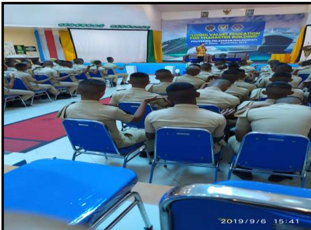
(Taruna mengikuti kegiatan Living Values Education For Character Building )