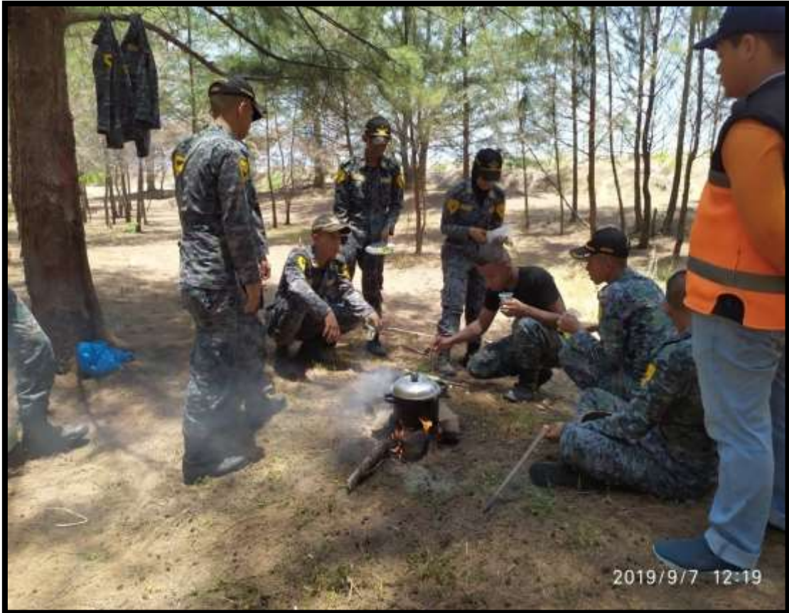
(Taruna/taruni dilatih untuk mampu bekerjasama secara tim)