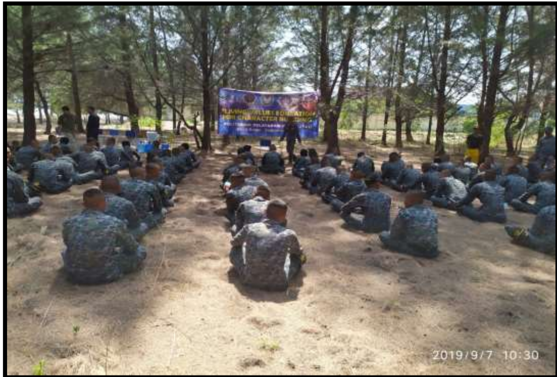
(Taruna mengikuti kegiatan terapan Living Values Education For Character Building di alam terbuka)