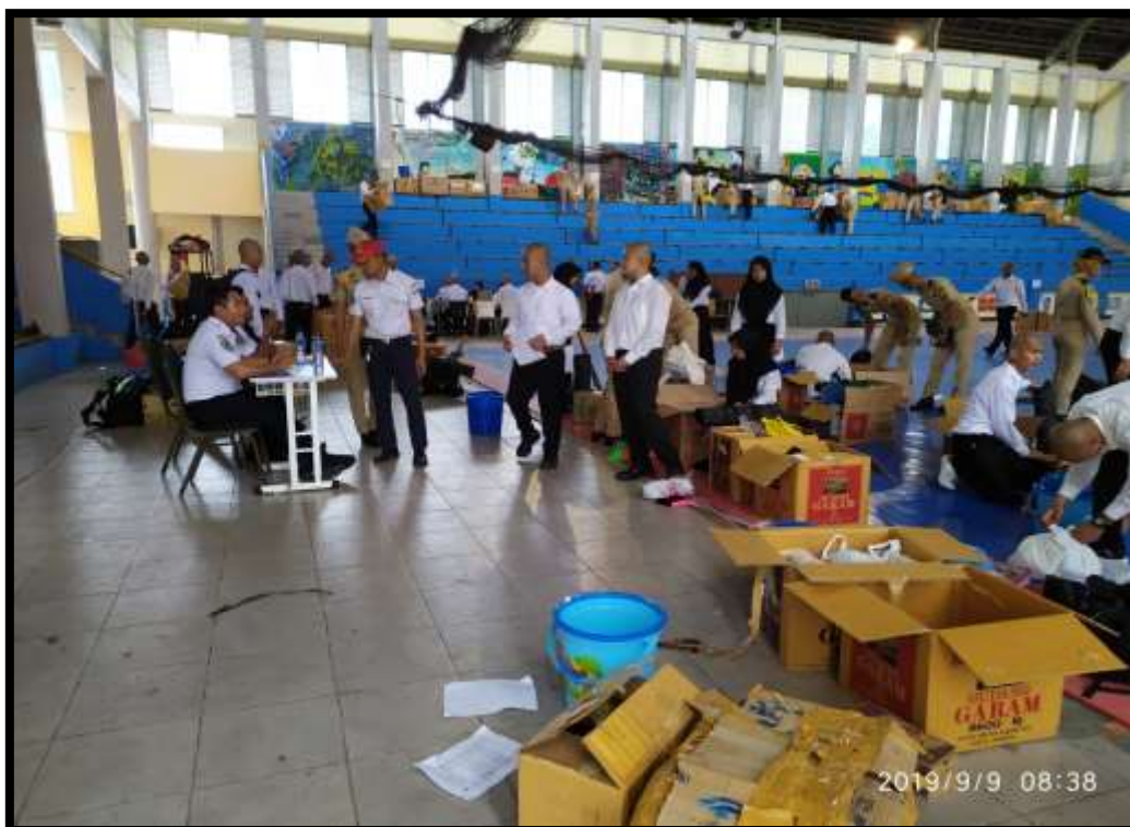
(Sebelum taruna/taruni diterima masuk ke dalam asrama, segala perlengkapan taruna yang dibawa dari rumah (keluarga), akan diperiksa oleh pengasuh, pelatih, dan taruna senior)