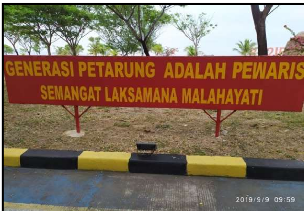
(Salah satu semboyan taruna/taruni Politeknik Malahayati Aceh)