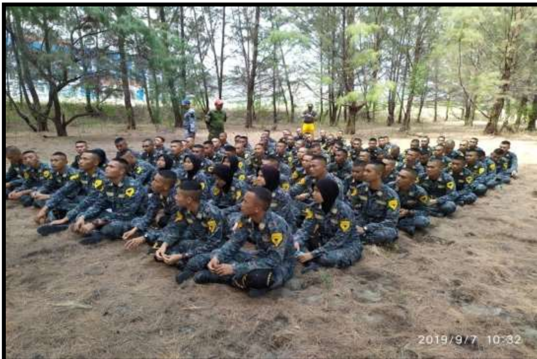
(Taruna mengikuti kegiatan terapan Living Values Education For Character Building di alam terbuka)