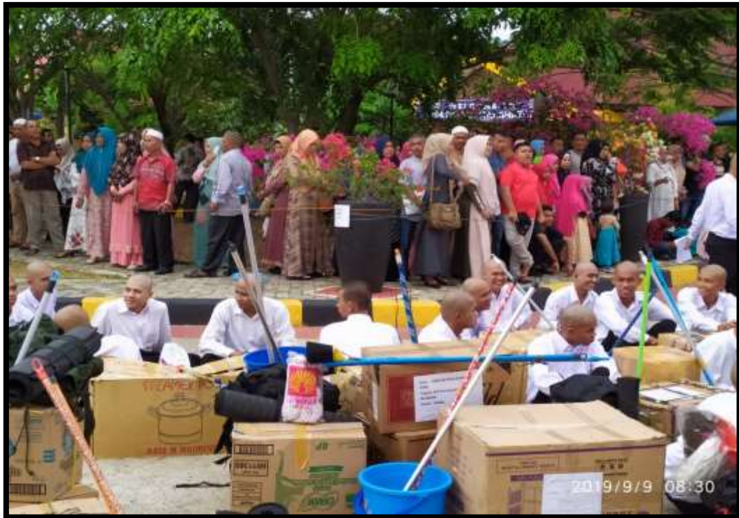
(Orang tua/wali taruna mengantarkan taruna/taruni muda untuk didik dan diasuh menjadi pelaut yang profesional di Politeknik Malahayati Aceh)