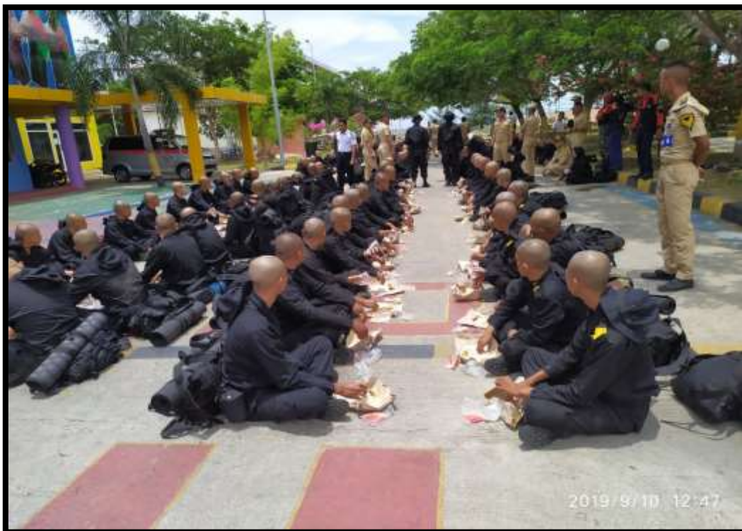
(Taruna/taruni melaksanakan kegiatan santap bersama, sebagai salah satu bentuk penanaman nilai semangat kebersamaan dan jiwa korsa)