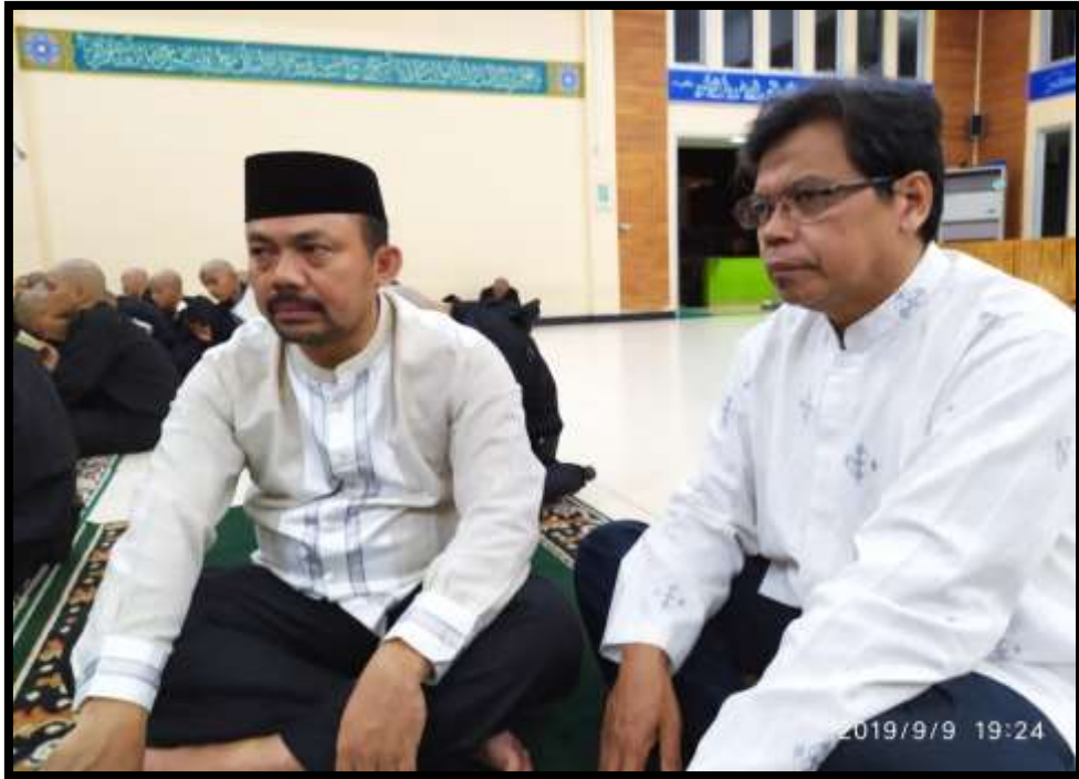
(Penulis bersama Pimpinan Politeknik Pelayaran Malahayati Aceh, saat melakukan wawancara dan pengamatan langsung proses sholat berjama'ah di mesjid kampus)