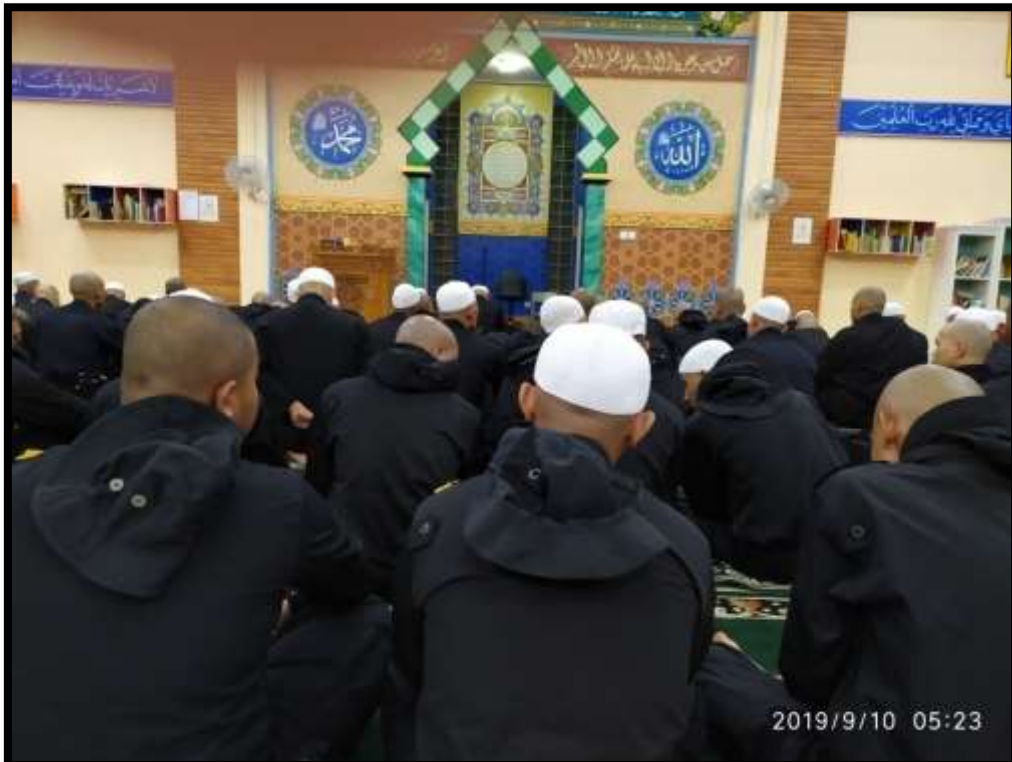
(Taruna/Taruni melaksanakan ritual keagamaan –Sholat berjamaah dengan tertib)