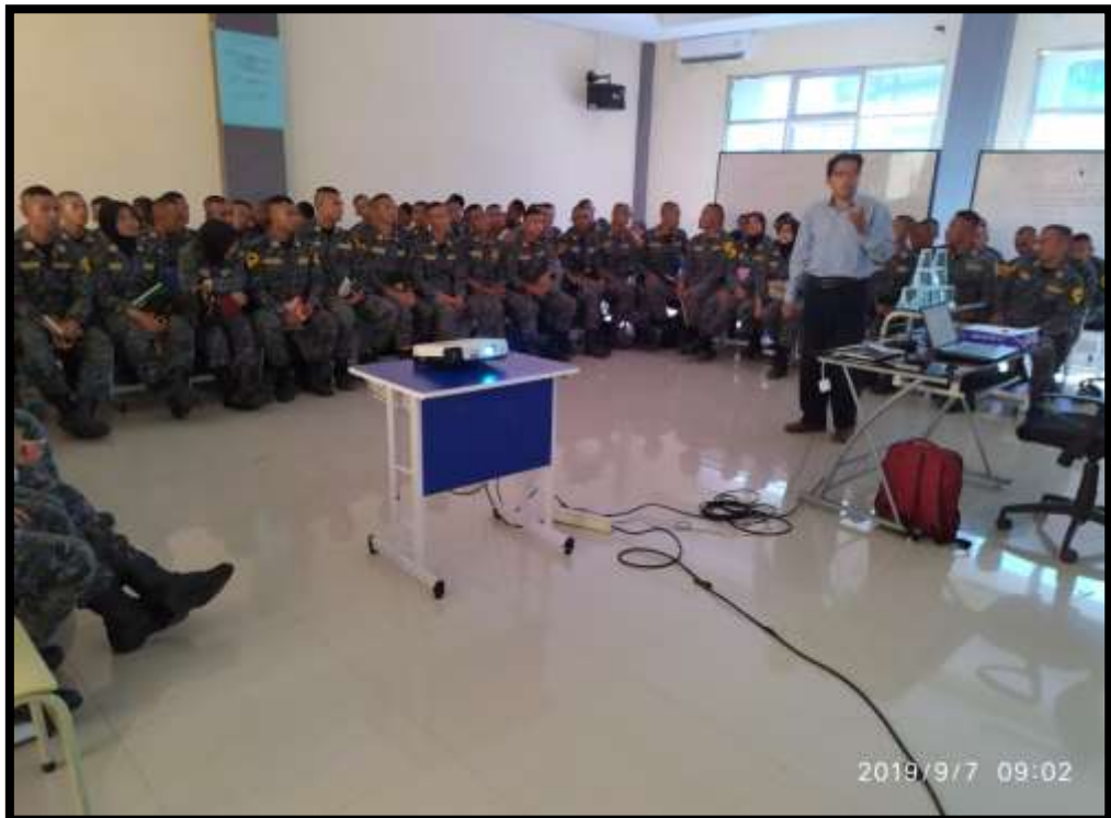
((Taruna dikenalkan dengan nilai-nilai spritual dalam kaitannya dengan profesi dan tantang dunia kerjanya- terlihat penulis sebagai pemberi materi)