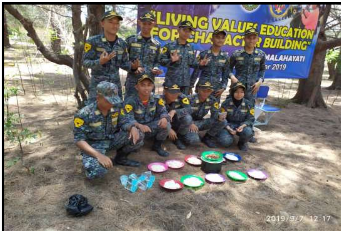
(Taruna/taruni dilatih untuk mampu bekerjasama secara tim)