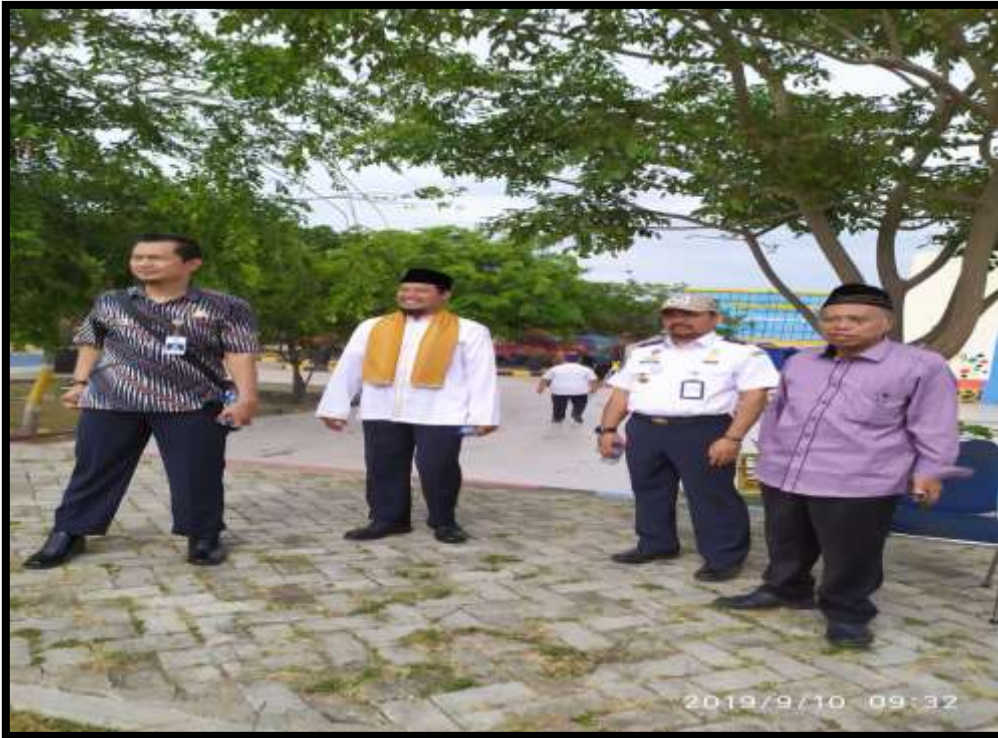
(Penulis bersama Pimpinan Politeknik Pelayaran Malahayati Aceh, saat melakukan wawancara dan pengamatan langsung proses penyelenggaraan masa orientasi taruna baru