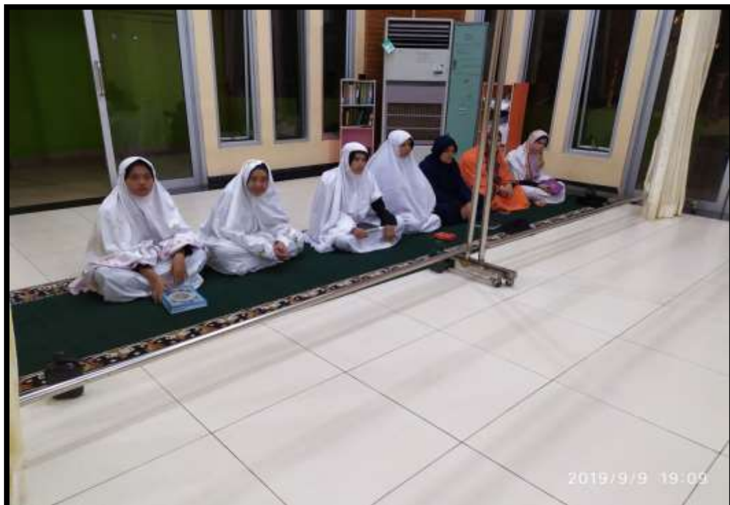
(Kegiatan sholat berjama'ah taruni politeknik pelayaran Malahayati Aceh)