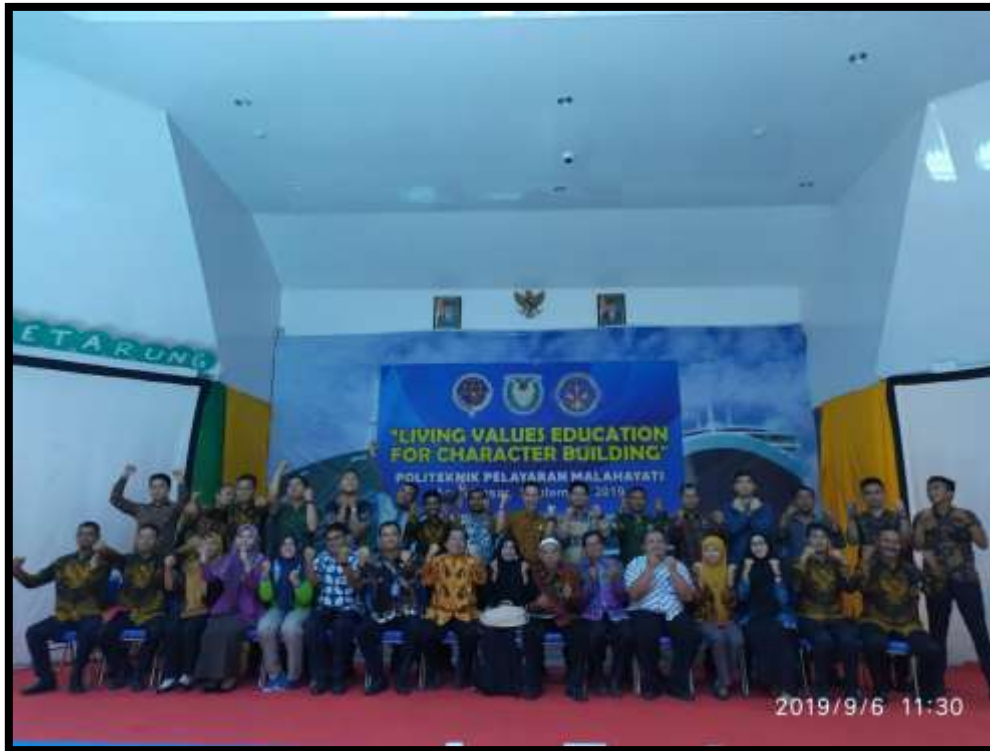
(Para pelatih, pengasuh, dan unsur pimpinan Politeknik Pelayaran Malahayati Aceh mengikuti kegiatan Living Values Education For Character Building )