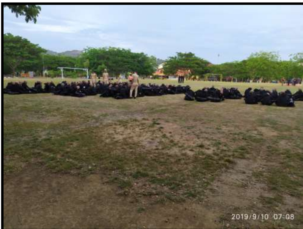
(Pelaksanaan masa orientasi taruna/taruni baru yang dilaksanakan oleh teruna/taruni senior dibawah arahan tim pelatih dan penagasuh)