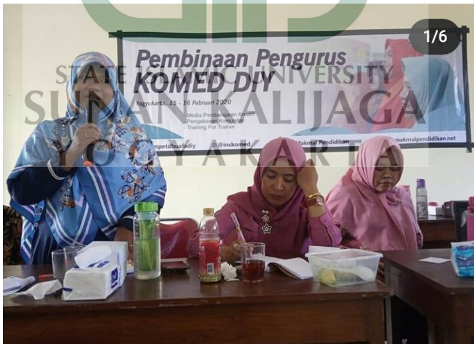
Program Komunitas Media Pembelajaran (KOMED)