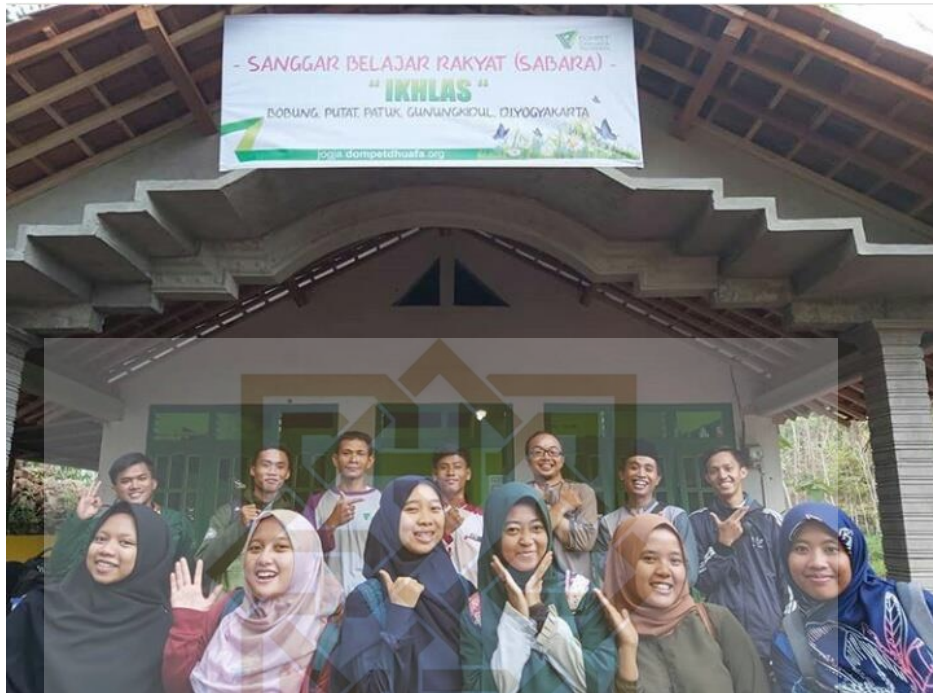
Program Sanggar Belajar Rakyat (SABARA)