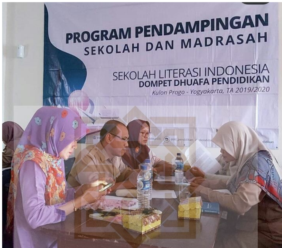
Program Sekolah Literasi Indonesia