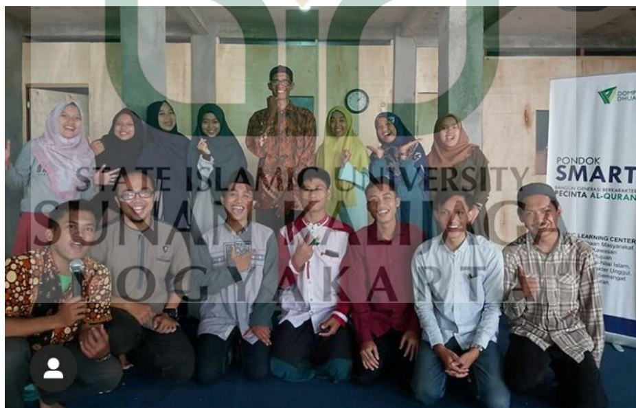
Program pembinaan Beasiswa Inspiratif