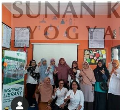
Program Inspiring Library