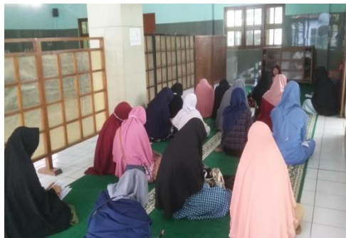
Gambar 3: Suasana Kajian Mumtaza Masjid Asy Syakirin Karangkajan