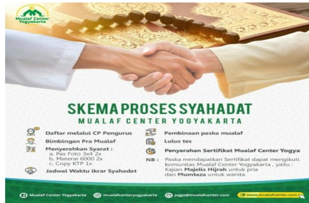
Gambar 1: Skema Proses Syahadat