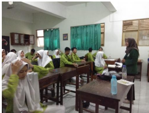
Proses pemberian kuesioner kepada siswa MAN 2 Yogyakarta