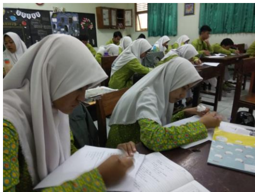
Proses pengisian kuesioner oleh siswa MAN 2 Yogyakarta