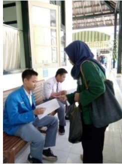
Proses pemberian kuesioner kepada siswa MAN 1 Yogyakarta