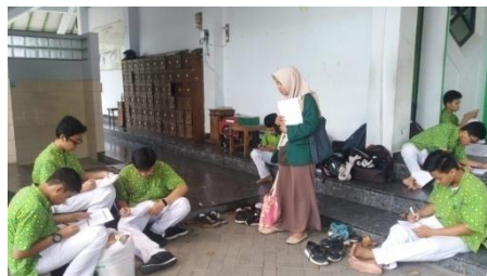
Proses pengisian kuesioner oleh siswa MAN 1 Yogyakarta