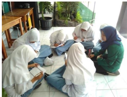
Proses pengisian kuesioner oleh siswa MAN 1 Yogyakarta