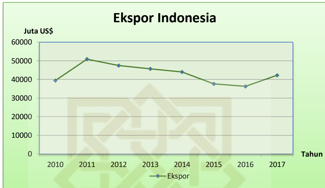
Gambar 1.1 Grafik Ekspor Indonesia Tahun 2010-2017

Sumber : Data diolah dari Badan Pusat Statistik