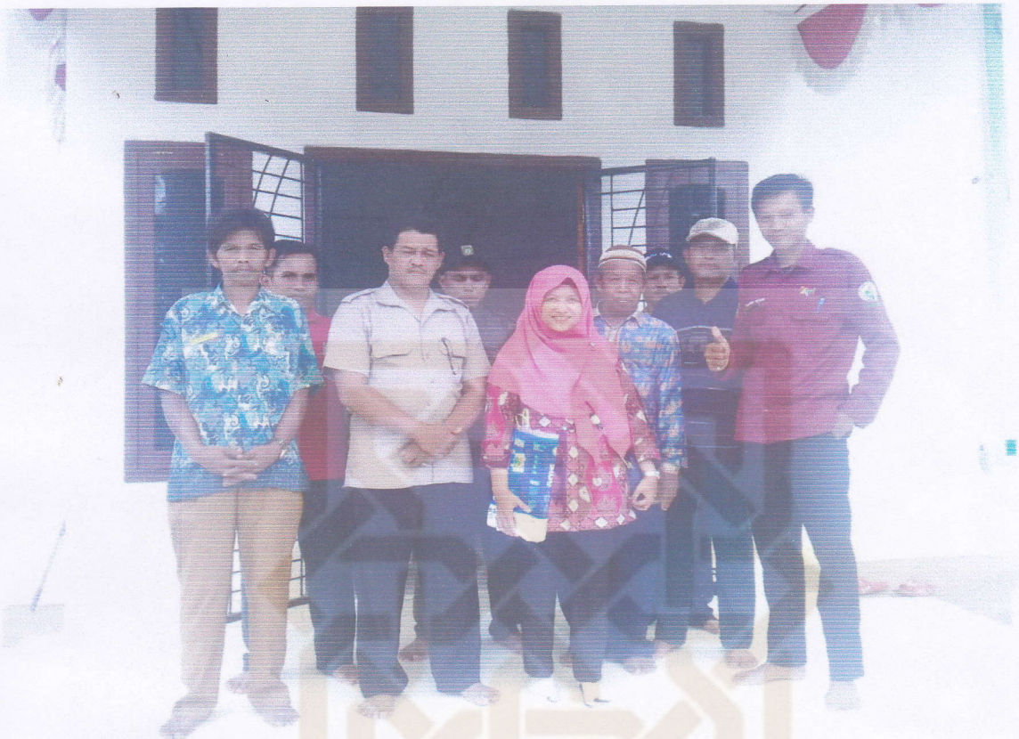
Bersama Perangkat Dusun Bukit Sari