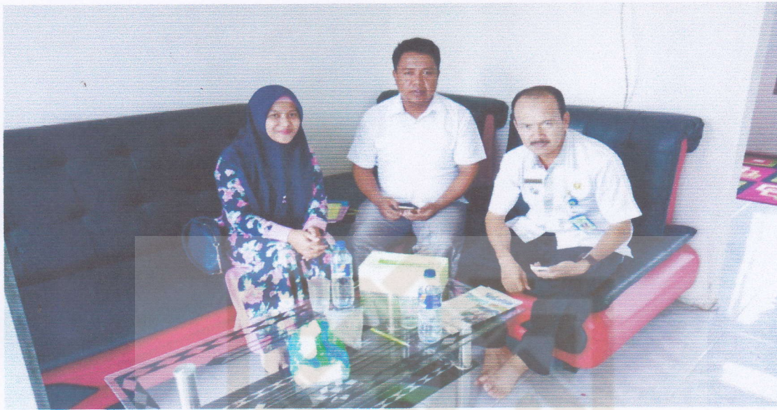
Bersama Bapak Camat Kecamatan Jujuhan Ilir