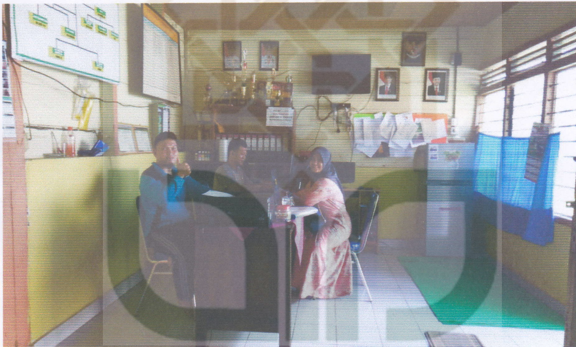
Bersama Perangkat Desa Aur Gading