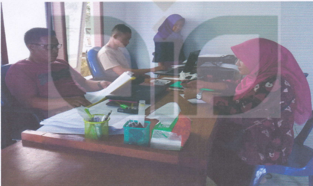
Bersama Perangkat Dusun Kuamang