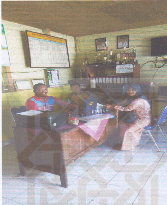
Bersama Perangkat Desa Aur Gading