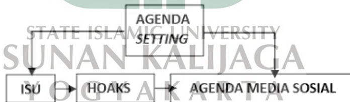
Tabel 1 : Agenda Setting

Agenda Setting adalah teori yang menyatakan bahwa media massa merupakan pusat penentuan kebenaran dengan cara menggunakan media massa untuk mentransfer dua elemen, yaitu kesadaran dan informasi ke dalam agenda publik (kepentingan masyarakat tertentu). Sederhananya yaitu mengarahkan kesadaran publik serta perhatiannya kepada isu-isu yang dianggap penting oleh media massa.