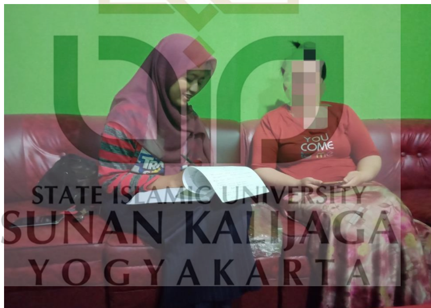
Gambar 6 Saat Wawancara dengan ibu SP