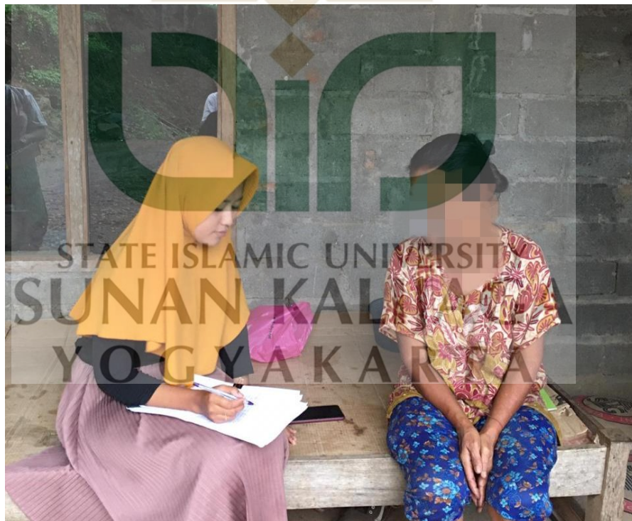
Gambar 2 Saat Wawancara dengan ibu YT