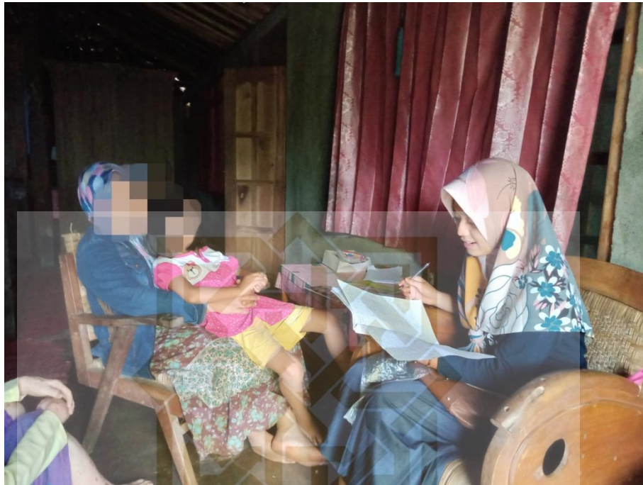
Gambar 7 Saat Wawancara dengan ibu WS