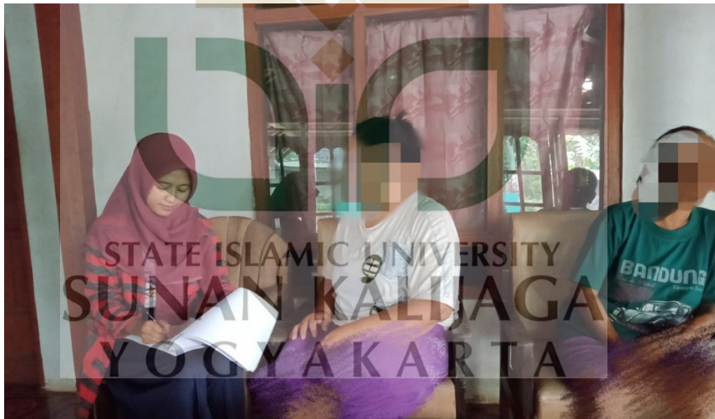
Gambar 10 Saat Wawancara dengan mbak AN