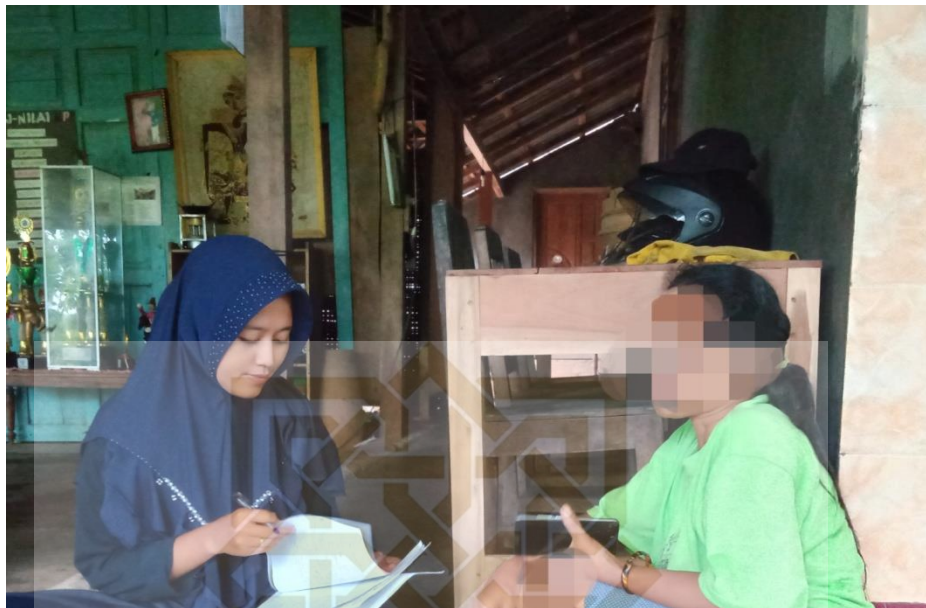
Gambar 5 Saat Wawancara dengan ibu LN