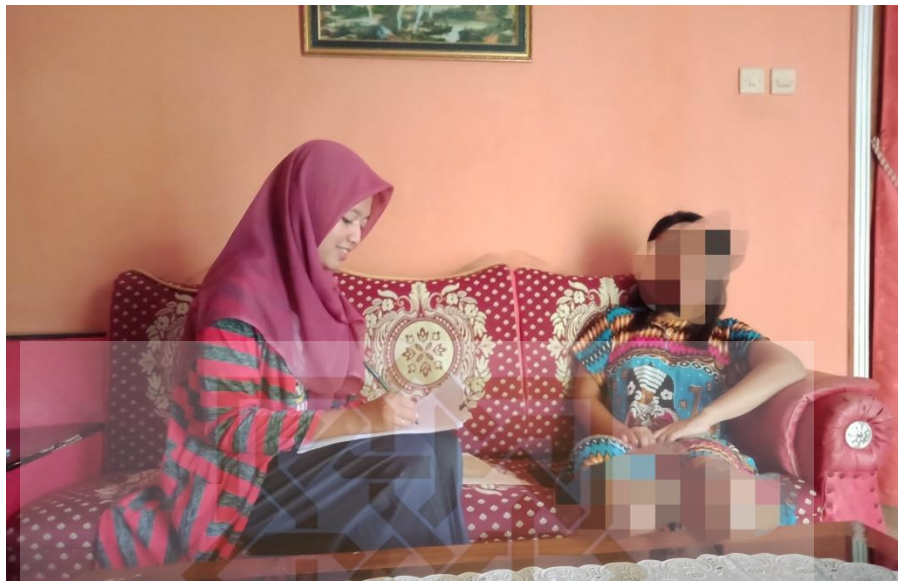
Gambar 9 Saat Wawancara dengan mbak PJ