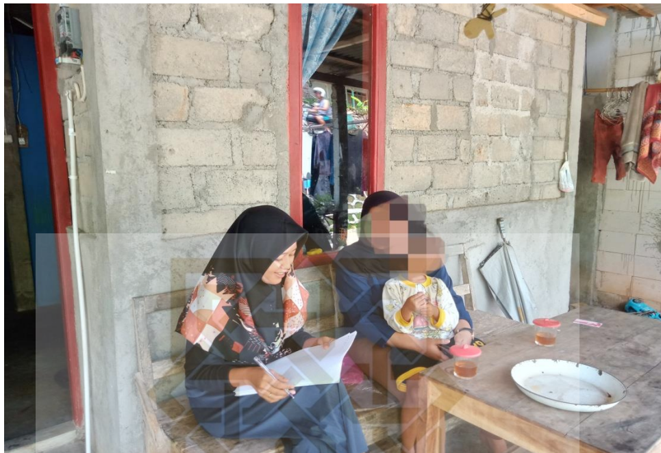
Gambar 3 Saat Wawancara dengan mbak TY