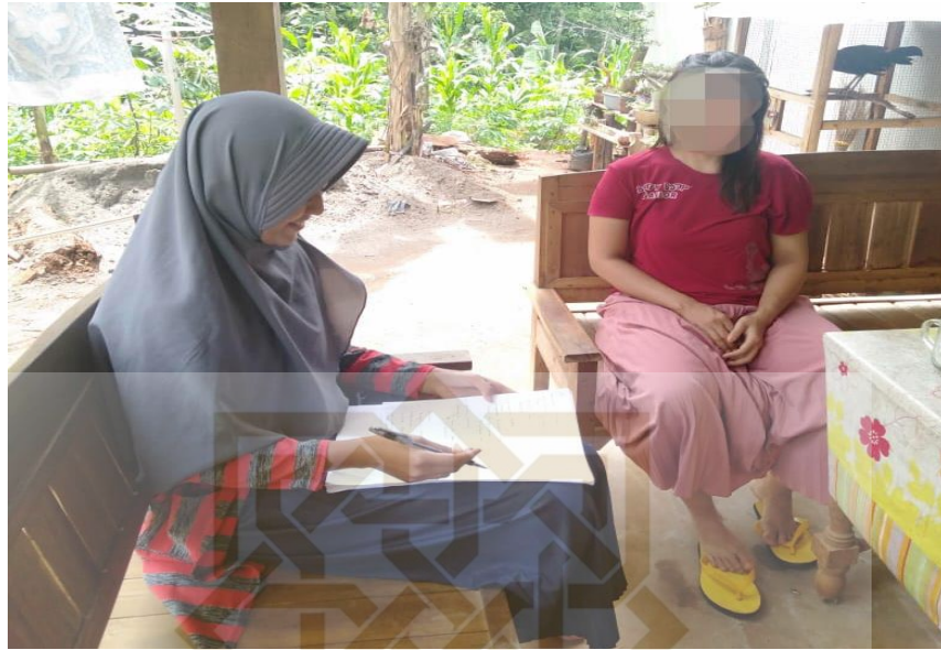
Gambar 1 Saat Wawancara dengan Mbak NG