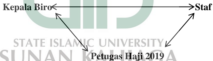
Gambar 1.1 Triangulasi Sumber Data