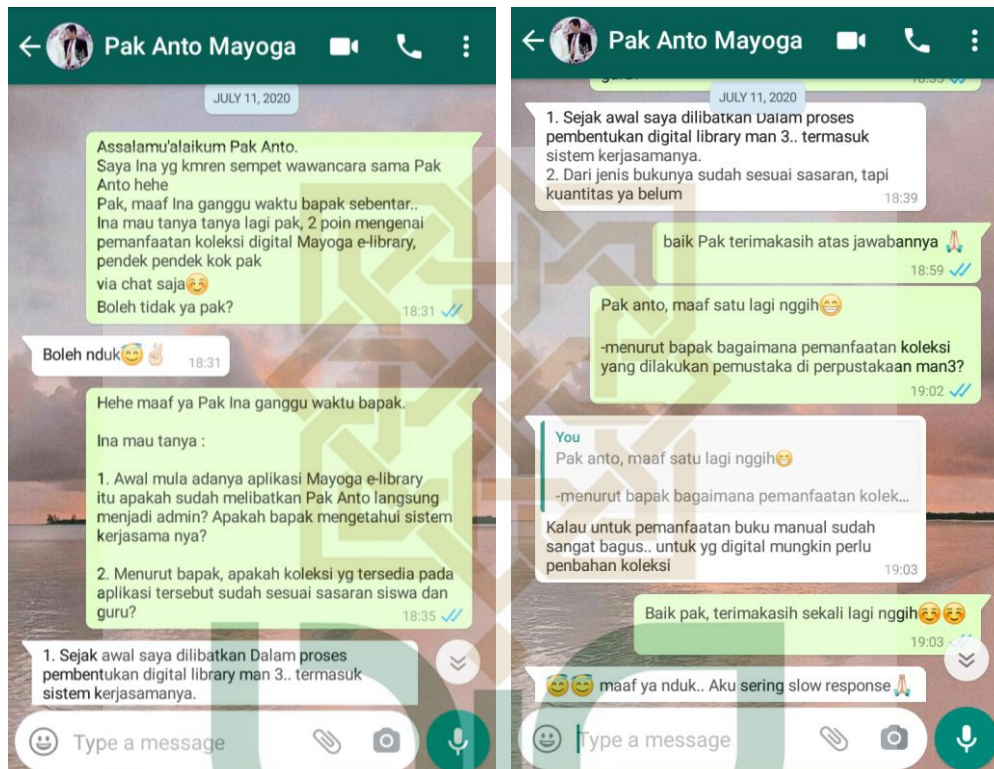
Chat whatsapp dengan informan (AI)

STATE ISLAMIC UNIVERSITY SUNAN KALIJAGA YOGYAKARTA