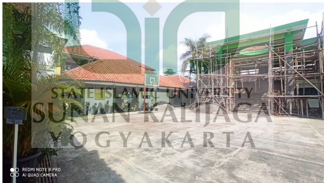
Gambar 2. Sarana olahraga MAN 2 Sleman