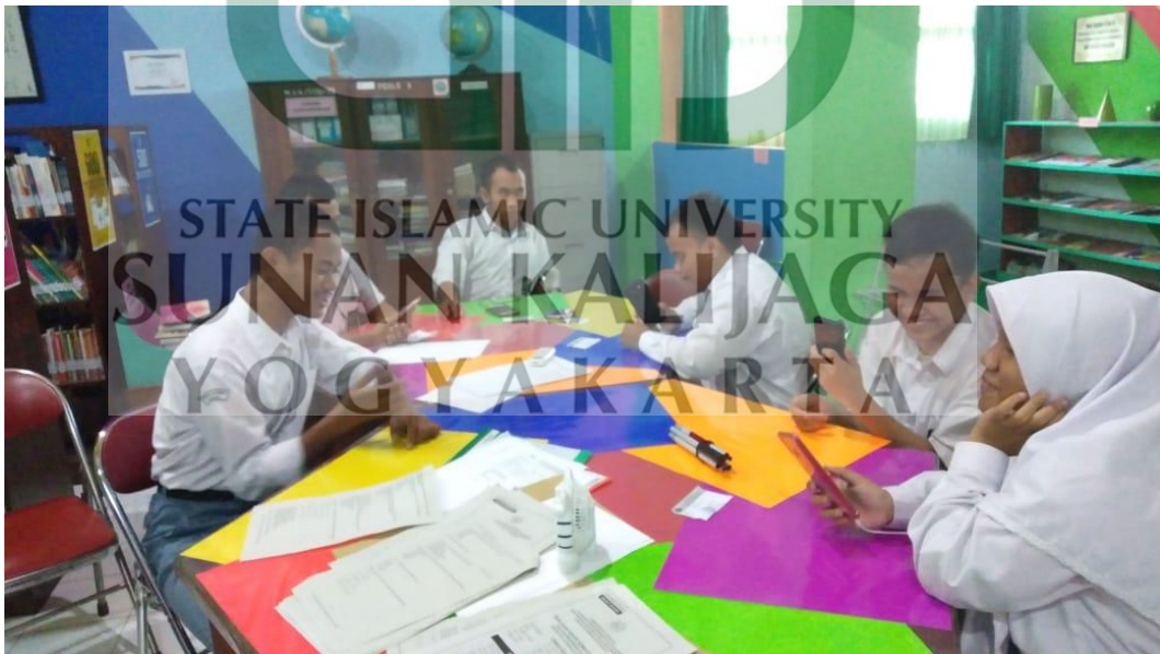
Gambar 4. Proses pembelajaran siswa tunanetra di MAN 2 Sleman