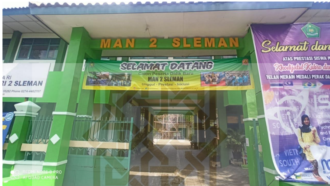
Gambar 1. Pintu masuk MAN 2 Sleman