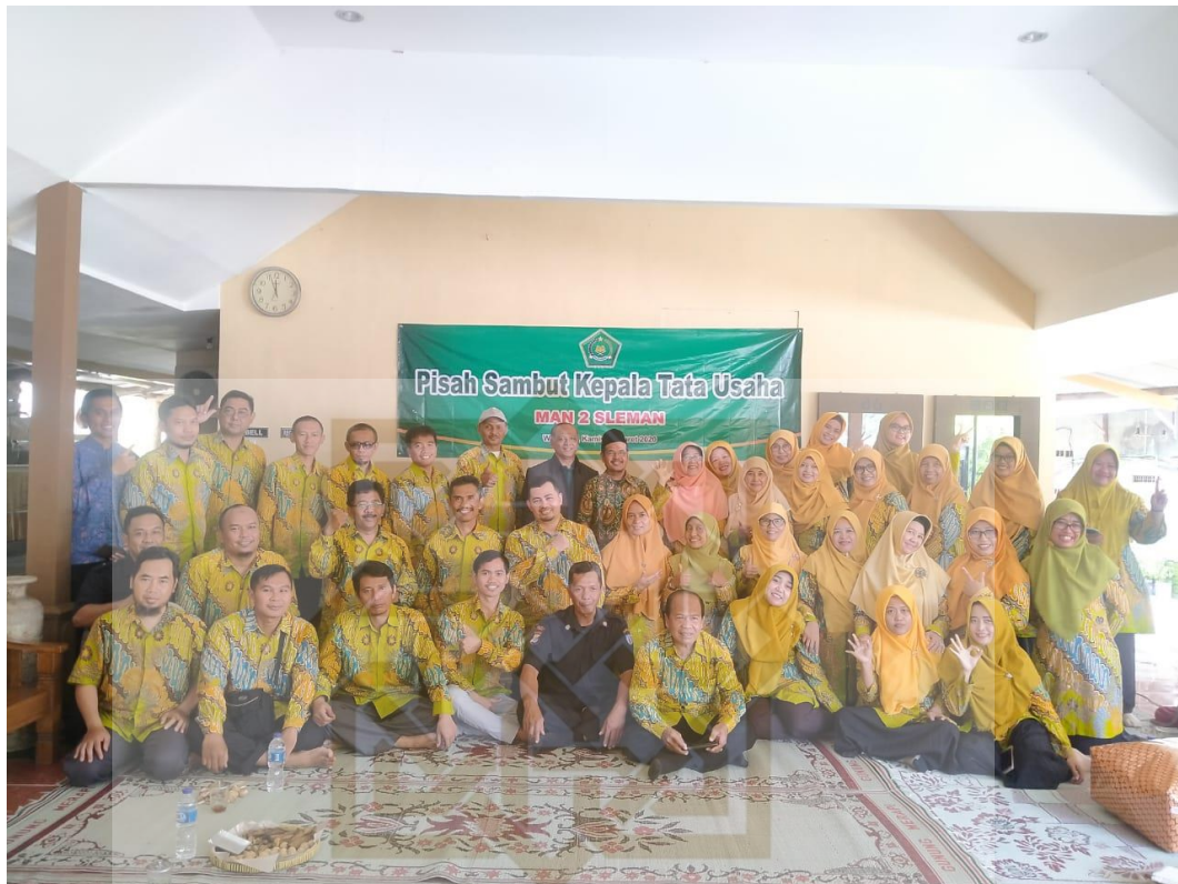
Gambar 3. Guru dan staf karyawan MAN 2 Sleman