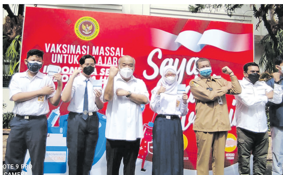
Wakil Gubernur DIY Paku Alam X (ketiga kiri) dan Walikota Yogyakarta Haryadi Suyuti (ketiga kanan) bersama perwakilan siswa yang mengikuti vaksinasi di SMA N 1 Yogyakarta.

Saat melakukan peninjauan secara langsung vaksinasi serentak nasional di SMAN 1 Yogyakarta, Wakil Gubernur (Wagub) DIY, Sri Paduka Paku Alam X menyatakan, terima kasih atas prakarsa dari Badan Intelijen Negara Daerah DIY (Binda