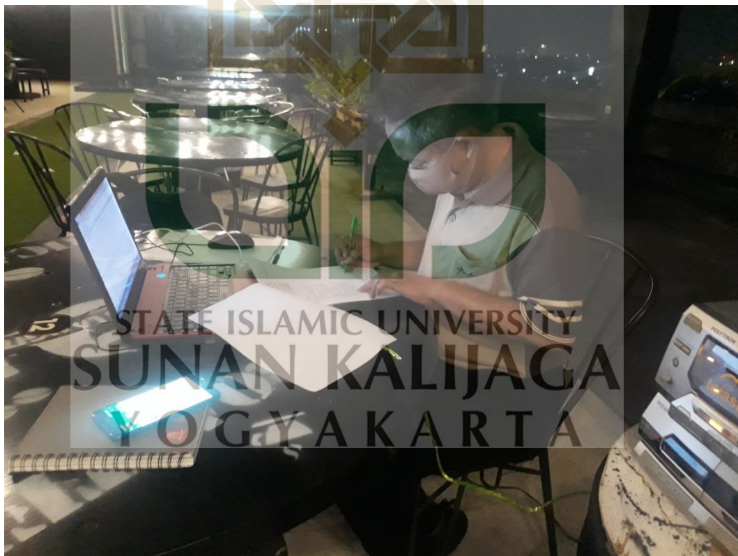
Pengisian Kuesioner Oleh Manajer Teras Langit