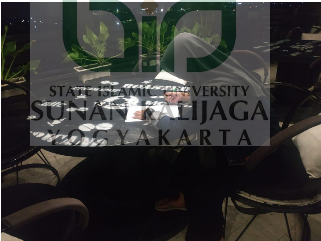
Pengisian Kuesioner Oleh Pengunjung Teras Langit