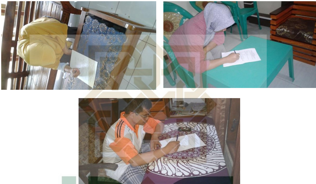
Foto bersama karyawan KJKS An-Nur Banjarnegara

Foto responden saat sedang mengisi kuesioner