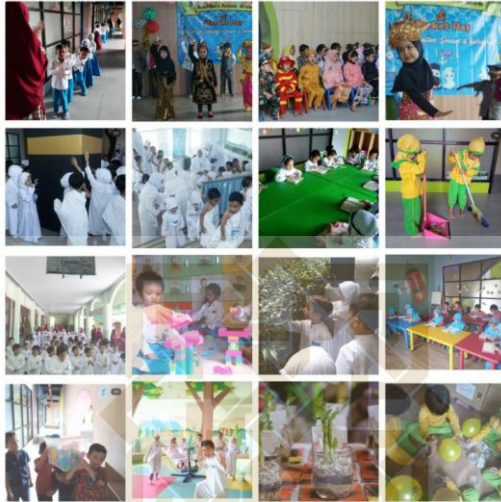
Gambar Kegiatan Anak Sebelum Pandemi