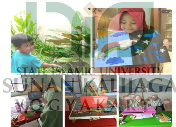
Gambar Kegiatan Anak Setelah Pandemi