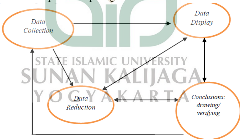
Gambar 1. Komponen dalam analisis data ( interaktif model )

Analisis data dalam penelitian kualitatif dilakukan peneliti ketika mengumpulkan data untuk memudahkan pemahaman terhadap hasil yang diperoleh. Berikutnya bentuk interaktif dari analisis data dapat dilihat pada gambar berikut