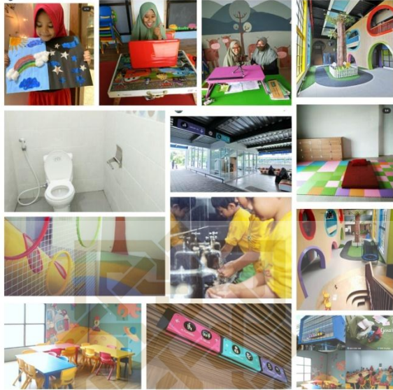
Gambar sarana dan prasarana Taman Kanak-kanak AnakQu

QIB STATE ISLAMIC UNIVERSITY SUNAN KALIJAGA YOGYAKARTA