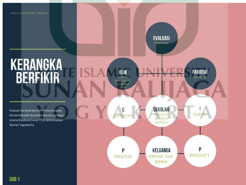
Gambar 1.1 Kerangka Berfikir