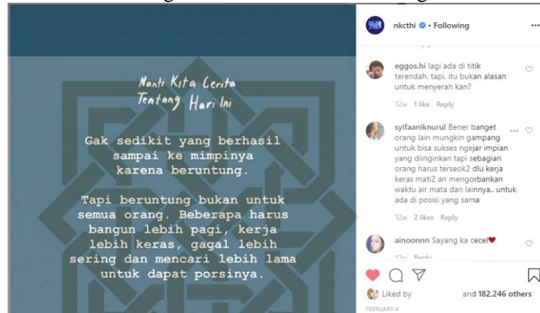
Gambar 2 : Postingan dan komentar akun instagram @nkcthi