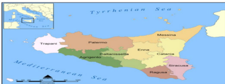
Gambar: Peta Wilayah Aghlabiyyah

Dinasti Aghlabiyyah (184-296 H/800-908 M). Dinasti Aghlabiyyah merupakan sebuah dinasti yang pusat pemerintahannya berada di