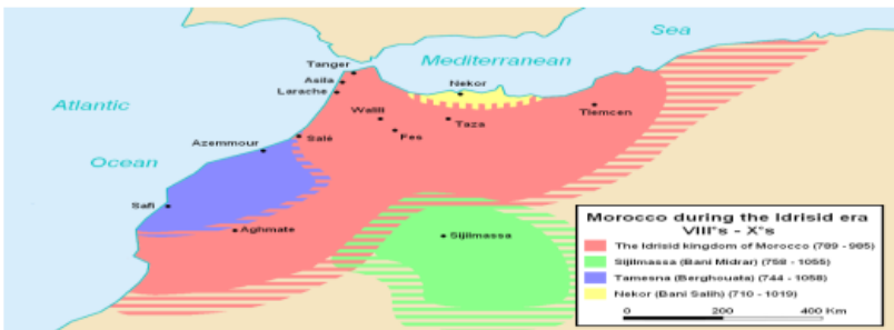
Gambar: Peta Wilayah Dinasti Idrisiyyah

Dinasti Idrisiyyah di Maroko (172-375 H/788-985 M). Keberhasilan Bani Abbasiyah dalam menaklukkan Dinasti Umayyah dibantu oleh keluarga Alawiyyun dan kelompok Syiah. Namun, setelah Dinasti Abbasiyah berjaya, permintaan mereka tidak diindahkan dan mereka merasa dikhianati oleh Bani Abbasiyah. Kekecewaan membuat mereka memberontak dan pemberontakan dilakukan oleh dua orang bersaudara dari keturunan Ali bin Abi Thalib, yaitu Muhammad (al-Nafs al-Zakiyyah) dan Ibrahim, yang mana keduanya adalah putra Abdullah ibnu Hasan ibnu Ali. Akan tetapi, pemberontakan mereka dapat dilumpuhkan oleh penguasa dikarenakan pasukan penguasa Abbasiyah masih sangat kuat. Pada tahun 144 H, Muhammad terbunuh di Madinah dan setahun kemudian yakni pada tahun 145 H, Ibrahim juga terbunuh di daerah antara Kufah dan Wasith. Ketika kekhalifahan di tangan al-Hadi, kelompok Alawiyyun kembali melakukan pemberontakan terhadap Bani Abbasiyah di Fakh (kota kecil antara Makkah dan Madinah) yang dipimpin oleh al-Husain ibnu Ali ibnu al-Hasan yang dikenal dengan peristiwa mauqi' fakh. Dalam pertempuran ini kelompok Alawiyyun gagal, dan mengakibatkan al-Hasan gugur bersama sejumlah keluarga Alawiyyun yang lain.