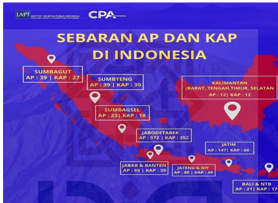
Gambar 1.1 Peta Persebaran Akuntan Publik dan Kantor Akuntan Publik di Indonesia bagian 1

Yogyakarta, jumlah akuntan publik masih sangat minim. Berikut peta persebaran jumlah akuntan publik dan kantor akuntan publik di Indonesia 6 :