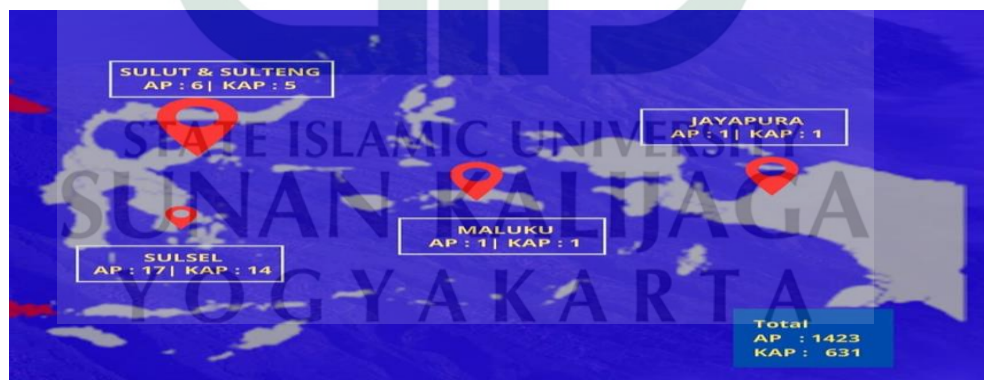
Gambar 1.2 Peta Persebaran Akuntan Publik dan Kantor Akuntan Publik di Indonesia bagian 2