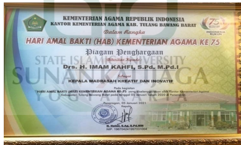
Gambar 1. Piagam Penghargaan Kepala MAN 1 Tulang Bawang Barat

Dengan demikian, data diatas menunjukkan bahwa kepala madrasah telah mampu membawa madrasahny menjadi maju dan berkembang serta mampu bersaing dengan madrasah-madrasah yang lainnya serta dapat menjadikan madrasah ini sebagai salah satu madrasah favorit di lingkungan Tulang Bawang Barat. Kemudian, kepala MAN 1 Tulang Bawang Bawang ini juga memperoleh prestasi berupa “kepala madrasah yang kreatif dan inovatif se-Provinsi Lampung”, hal ini dibuktikan dengan dokumentasi berupa sertifikat yang diterimanya pada sebuah acara peringatan Hari Amal Bakti (HAB) Kementerian Agama ke-75 yang diselenggarakan di Kantor Kementerian Agama Tulang Bawang Barat pada tanggal 05 Januari tahun 2020 di Panaragan. Adapun bukti sertifikatnya terlampir pada gambar dibawah ini, sebagai berikut: 15