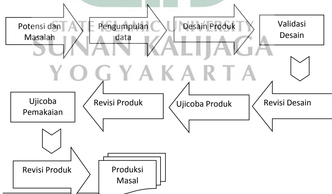
Gambar 1.1. Langkah Penelitian R&D menurut Borg&Gall

Tahapan penelitian tersebut divisualisasikan dalam bagan sebagai berikut: