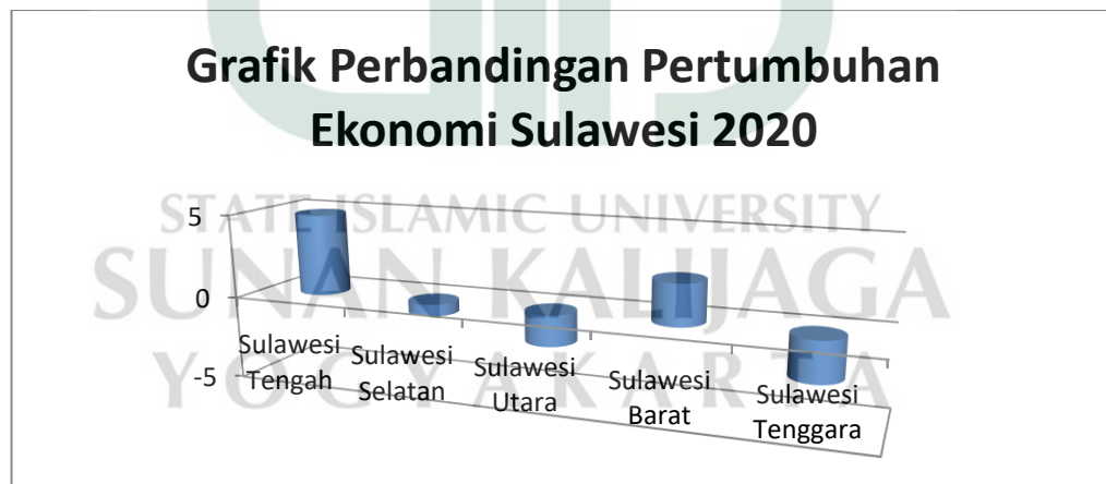
Gambar 1.2: Grafik Pertumbuhan Ekonomi Sulawesi 2020