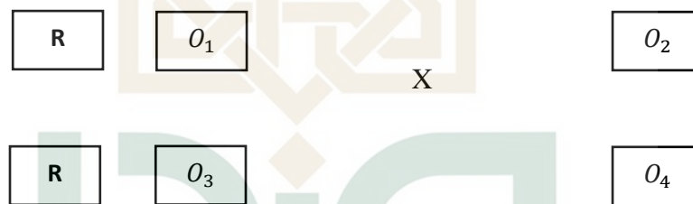
Gambar 3. Desain uji coba dengan pretest posttest controll group design

Desain uji coba utama pada penelitian ini dengan menggunakan pretest-posttest control group design . Desain pretest-posttest control group design dilakukan dengan mengukur kemampuan awal peserta didik pada kelas eksperimen maupun kelas kontrol dengan memberikan pretest . Setelah itu dilaksanakan pembelajaran dengan menggunakan Ensiklopedia Sejarah Perkembangan Islam Masa Klasik untuk kelas kontrol maupun kelas eksperimen. Kemudian diakhir pembelajaran peneliti memberikan posttest kepada peserta didik baik kelas eksperimen maupun kelas kontrol.