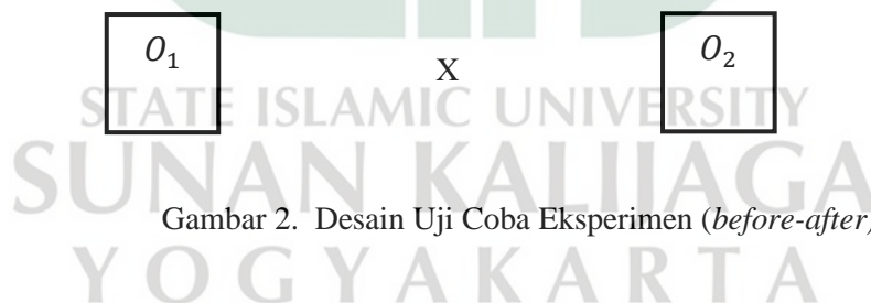
Gambar 2. Desain Uji Coba Eksperimen ( before-after )

Pada penelitian ini, peneliti menggunakan desain uji coba yang bertujuan untuk mengetahui keadaan sebelum menggunakan produk dengan setelah menggunakan produk. Desain penelitian ini dilaksanakan dengan cara mengukur kemampuan peserta didik sebelum menggunakan produk dengan setelah menggunakan produk. Uji coba tersebut dilakukan dengan menggunakan rancangan desain eksperimen before, after sesuai dengan gambar berikut: