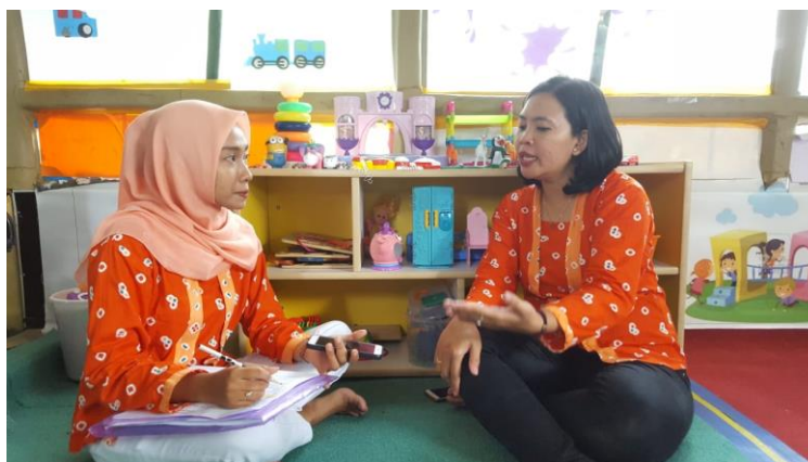
Gambar 1 Wawancara dengan Miss Silvi