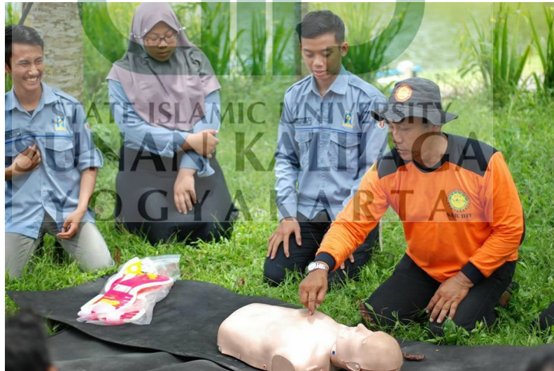
Gambar 2. Pelatihan Water Rescue bersama Mapala UII