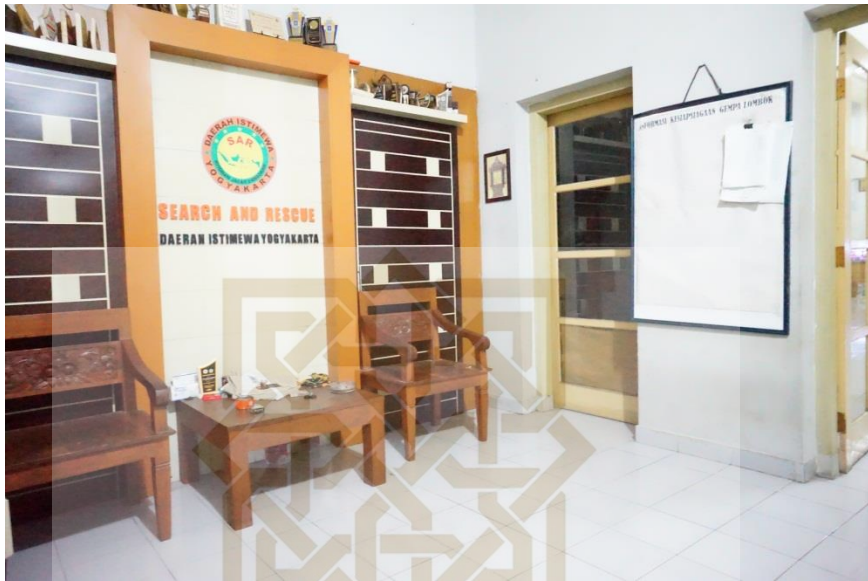
Gambar 6. Kondisi kantor SAR DIY