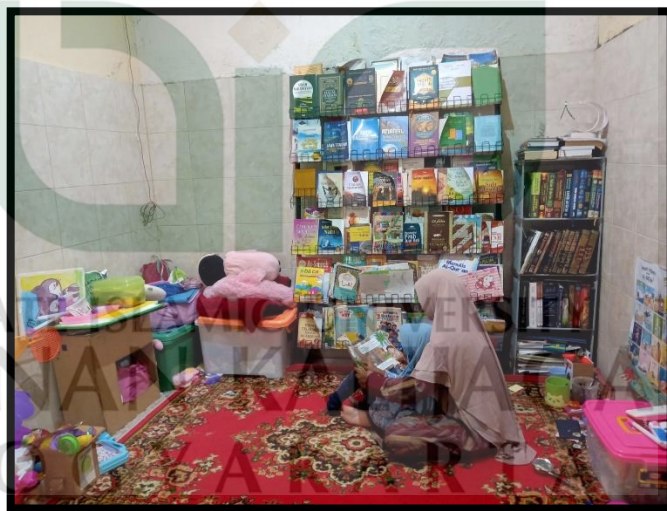
Gambar 1 : Perpustakaan Keluarga

anak yang lain seusinya asik bermain dan duduk bersama teman sebayanya, dengan membawa handphone ditangannya, sambil bermain game dan di antara dari mereka menonton konten yang tidak mendidik. Berdasarkan fenomena di atas, dilihat dari permasalahan yang ada di Perumahan Keci Cang Asri, terdapat perbedaan pola asuh orang tua dalam mendidik anak-anaknya terutama dalam memperhatikan anak dalam menumbuhkan minat baca. Tidak hanya itu, di tempat tersebut belum tersedianya fasilitas perpustakaan, sehingga dari permasalahan tersebut membuat anak kurang termotivasi untuk membaca. Berkaitan dengan hal tersebut, maka sebagai orang tua memegang peranan penting dalam pendidikan dan pengasuhan pola asuh orang tua dalam menumbuhkan minat baca anak. Berikut adalah gambar dari keluarga yang memiliki perpustakaan keluarga.