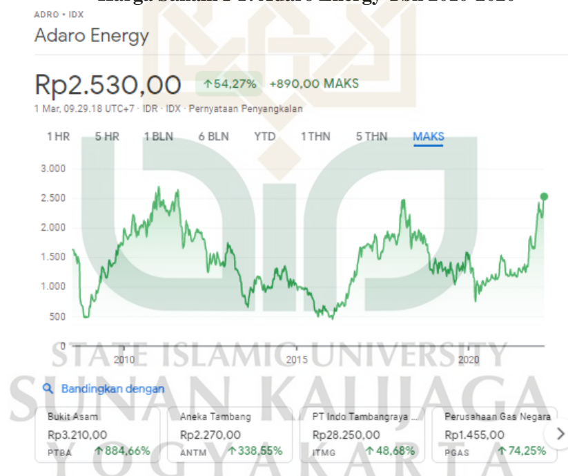
Gambar I.1. Harga Saham PT. Adaro Energy Tbk 2010-2020

Sedangkan untuk tahun 2014 mengalami kenaikan, harga saham ADRO dibuka pada harga Rp1.010,00 dan ditutup pada harga Rp1.065,00 yaitu mengalami kenaikan sebesar 5,44 %. Akan tetapi kembali mengalami penurunan harga saham pada tahun 2018, saham ADRO dibuka diharga Rp1.990 serta ditutup diharga Rp1.215,00 yang berarti menurun sebesar 38,94%.