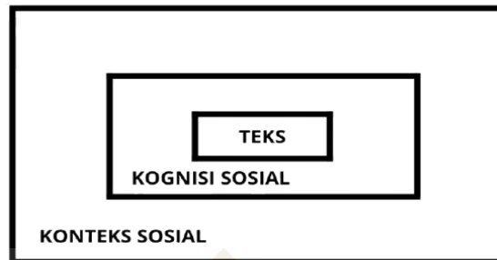
Gambar 1. 2 Model Analisis Van Dijk