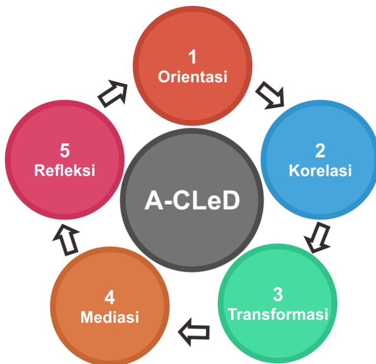
Gambar 2. Sintaks Model Art of Contextual Learning for Disability (A-CLeD)

data tersebut dapat dirumuskan model pembelajaran sains kontekstual yaitu Model pembelajaran Art of Contextual Learning for Disability (A-CLeD). Model A-CLeD ini memiliki sintak yaitu; (1) Orientasi, (2) Korelasi, (3) Transformasi, (4) Mediasi dan (5) Refleksi. Berdasarkan berbagai evaluasi maka diperoleh sintak model pembelajaran kontekstual untuk peserta didik difable netra adalah seperti terlihat pada gambar 2.