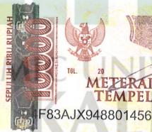
Nur Inke Flora