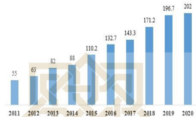
Gambar 1.1 Grafik Pertumbuhan Pengguna Internet di Indonesia