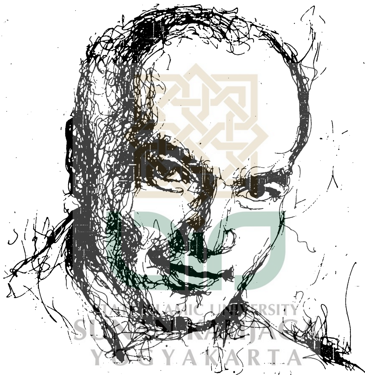
Dr. Ali Syari'ati