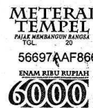
Siti Ulin Ni'mah Mz NIM: 08420010