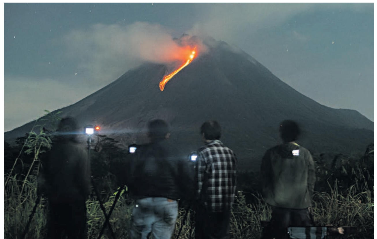
LAVA PIJAR MERAPI: Guguran lava pijar Gunung Merapi terlihat dari Turi, Sleman, Selasa (14/3/2023). Menurut data BPPTKG periode pengamatan 14 Maret 2023 pukul 00.00-06.00 WIB telah terjadi 15 kali guguran lava pijar dengan jarak luncuran maksimal 1.500 meter ke arah Barat.

Meskipun erupsi Gunung Merapi ini banyak ke arah Barat Daya, namun masyarakat tetap diimbau meningkatkan kesiapsiagaannya. Kemudian pada malam hari, masyarakat berjaga di pos-pos ronda.