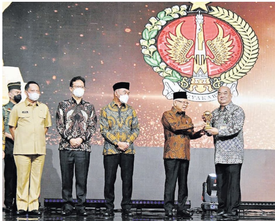
Wagub DIY Paku Alam X menerima penghargaan Universal Health Coverage (UHC) Award dari Wapres Ma'ruf Amin di Balai Sudirman, Jakarta, Selasa (14/3/2023).