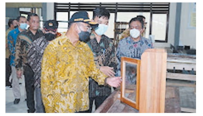
Menteri Koordinator Bidang Pembangunan Manusia dan Kebudayaan, Muhadjir Effendy (batik kuning) meresmikan Gedung KH Ahmad Dahlan di Pondok Pesantren Muhammadiyah Darul Arqam Patean.

"Saya juga pesan kepada Pak Camat Patean dan Kepala Desa supaya bisa membantu program pemenuhan asupan gizi untuk memenuhi gizi anak-anak di desa supaya bisa terpenuhi asupan proteinnya," ungkap Muhadjir. (Ati)-f