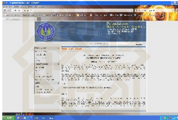
Gambar 5 Website UPT Perpustakaan UNY

Gambar diambil pada tanggal 15 Juli 2011