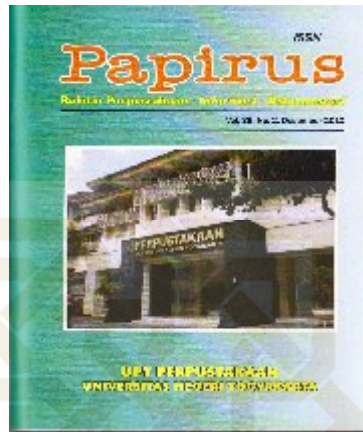
Gambar 6 Buletin Perpustakaan “PAPIRUS”