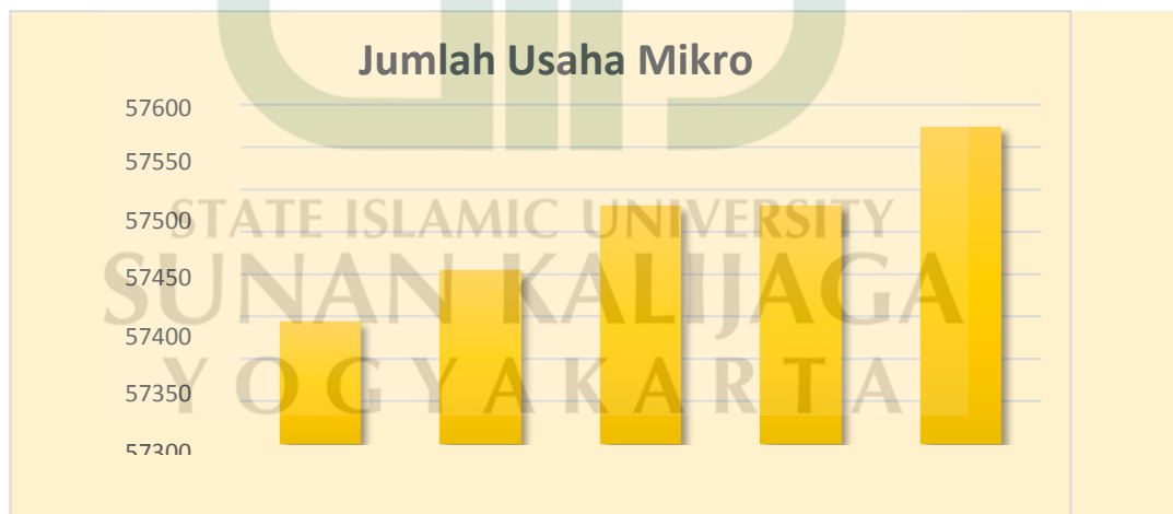
Gambar 1.1 Jumlah Usaha Mikro Kabupaten Situbondo 2017-2021

Penelitian ini dilakukan di Kabupaten Situbondo yang banyak terdapat industri kecil yang tergolong UMKM. Gambaran jumlah industri kecil di Kabupaten Situbondo sebagai berikut: