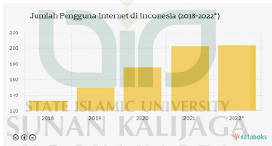
Jumlah Pengguna Internet Di Indonesia tahun 2018-2022