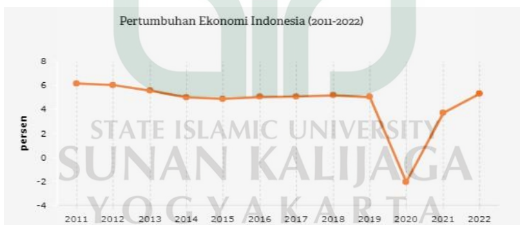
Gambar 1. 1 Laju Pertumbuhan Ekonomi

Berdasarkan dinamika perekonomian global saat ini yang sangat mudah mengalami peningkatan sekaligus penurunan, permasalahan nilai perusahaan dapat terjadi salah satunya adanya permasalahan kinerja keuangan seperti laba yang menurun dan pendapatan rendah tentunya hal tersebut menurunkan nilai perusahaan. Secara idealis peningkatan dan penurunan nilai perusahaan memiliki strategi tersendiri untuk melakukan stabilisasi agar pada posisi aman.