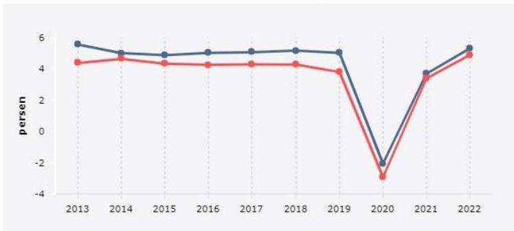
Gambar 1. 3 Grafik PDB Pertumbuhan Ekonomi dan Industri Pengolahan