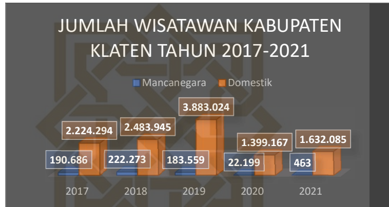
Gambar 1. 2 Jumlah Wisatawan Domestik Dan Mancanegara Di Kabupaten Klaten Tahun 2017-2021

(Sumber/Souce: Disbudparpora Kabupaten Klaten)