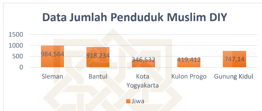
Gambar 1.1 Jumlah Penduduk Muslim DIY

sekitar 237,53 juta pada 2021 (BPS, 2021). Yogyakarta menjadi salah satu kota dengan mayoritas penduduk muslim, dengan persentase 92,87% atau 3.415.882 jiwa penduduknya memeluk agama Islam.