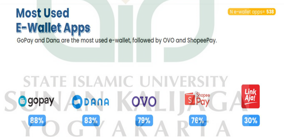
Gambar 1.1 Aplikasi E-wallet Yang Paling Banyak Digunakan

Menjamurnya kebiasaan masyarakat melakukan transaksi menggunakan e-wallet mengakibatkan peningkatan permintaan masyarakat akan produk-produk aplikasi e-wallet sehingga masyarakat dapat memilih produk mana yang dinilai lebih praktis (Silalahi dkk., 2022). Sebuah survei yang dilakukan oleh Populix pada Juli 2022 terhadap seribu responden berusia 18-55 di sejumlah kota besar di Indonesia menjelaskan terdapat lima aplikasi e-wallet yang diminati dan sering digunakan oleh masyarakat Indonesia yakni di posisi utama dengan Go Pay sebesar 88%, kemudian Dana sebesar 83%, OVO 79%, Shopee Pay 76%, dan LinkAja sebesar 30% (Populix, 2022).