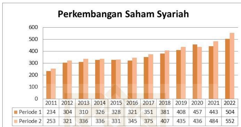
Gambar 1.1. Perkembangan Saham Syariah