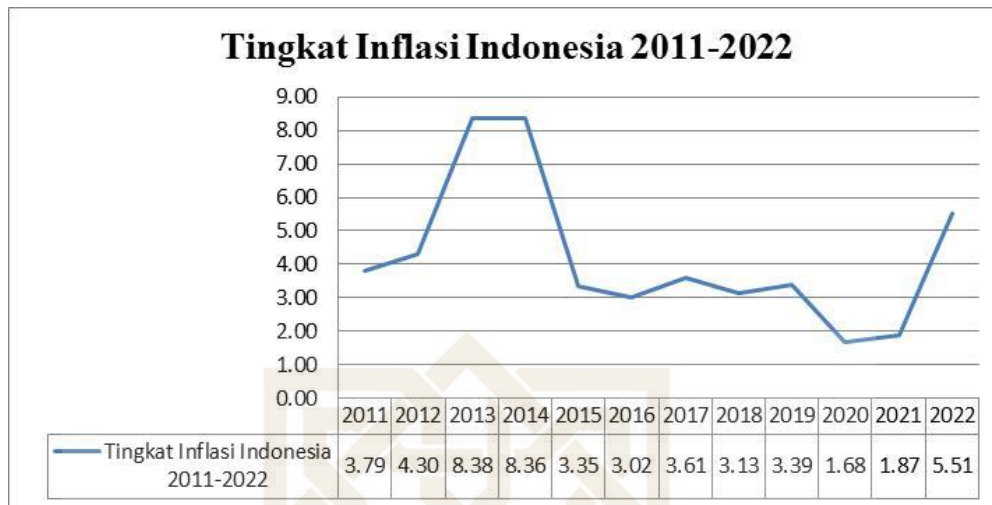
Grafik 1.2. Tingkat Inflasi Indonesia 2011-2021