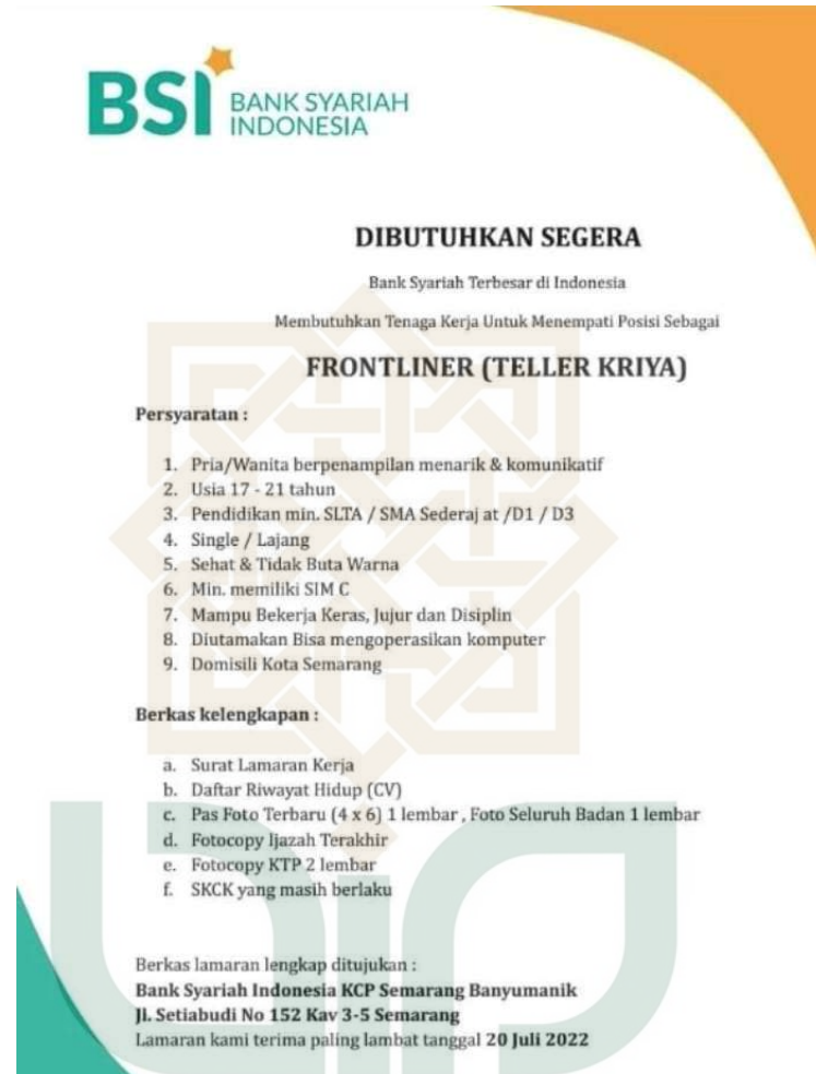
Gambar 1.1 Lowongan Kerja Bank Syariah