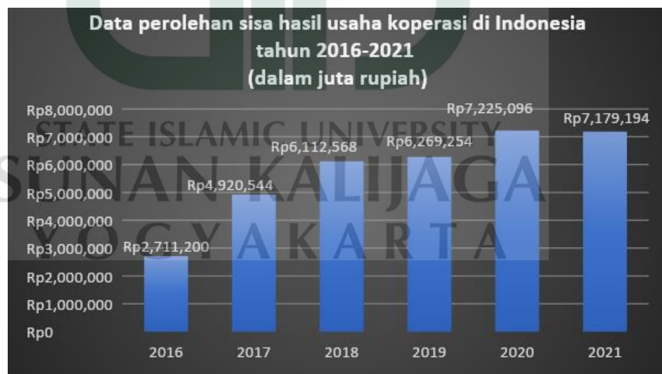
Gambar 1. 1 Grafik Data Perolehan SHU Koperasi di Indonesia Tahun 2016-2021

Sumber: https://kemenkopukm.go.id (Data diolah), 2022