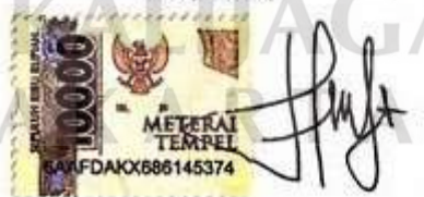
Duwi Ira Setianti